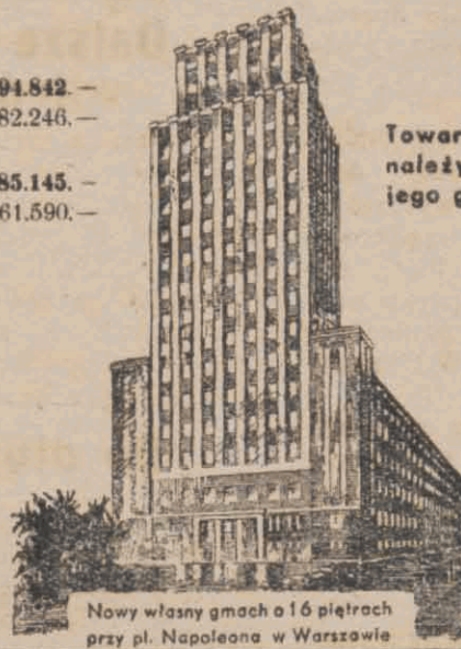
Nowy własny gmach o 16 piętrach przy pl. Napoleona w Warszawie

Czynności Dyrekcji Tow. „Prudential” na Polskę wykonywa Dyrekcja Tow. „Przezorność” w Warszawie, Plac Małachowskiego 4.