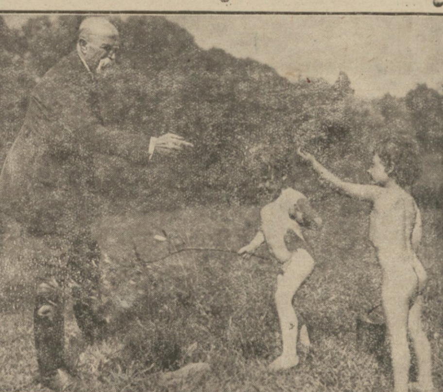
Masaryk ze swymi wnukami.

W gimnazjum Masaryk był wzorowym uczniem, na skutek jednak incydentu z dyrektorem gimnazjum zmuszony był Masaryk wystąpić z piątej klasy gimnazjum brnieńskiego i przenieść