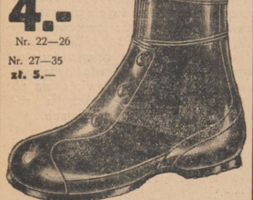
w kolorze czarnym i brązowym