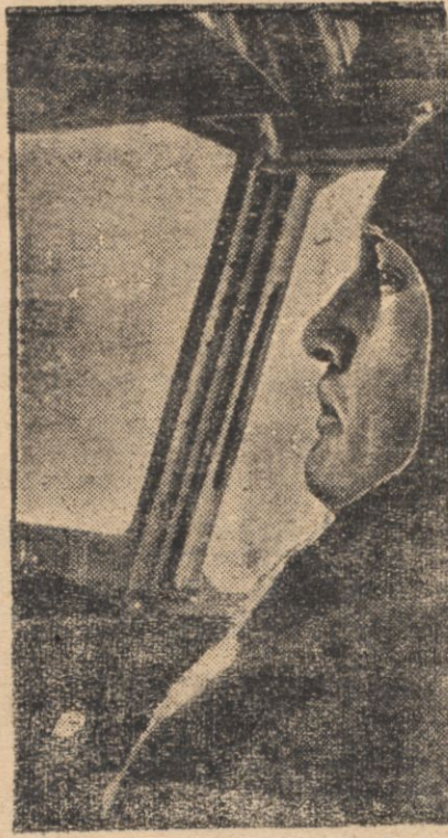
Mussolini uzyskał dyplom lotnika po odbyciu przepisowego lotu.

KLESKA „MARKSISTÓW”. SEWILLA 16.I. Komunikat rozgłosił powstanie z dnia 16 bm. godz. 13 m. 30: Wojska narodowe na froncie południowym w dalszej akcji zajęły san Pedro de Alcantara. Klęska „marksistów” przeobraziła się w ucieczkę na skutek akcji wspólnej marynarki, lotnictwa, armii lądowej i oddziałów zmotoryzowanych. Na froncie środkowym duch „marksistów” znacznie upadł na skutek ostatniego ataku „narodowego” na odcinku las Rozas. Pobiliśmy wojska rządowe na odcinkach dzelnicy uniwersyteckiej i Algora Siguenza. Na wszystkich frontach liczni milicjanci i cywile przechodzą do szeregów „narodowych”.