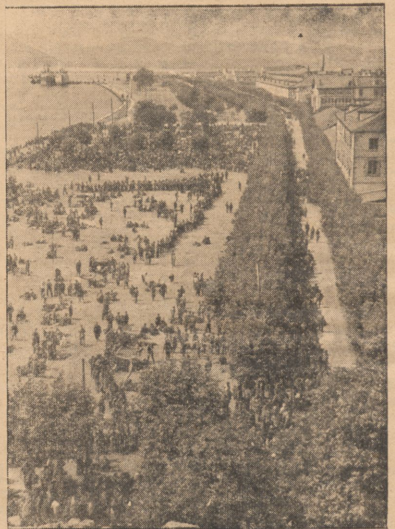
W Castro Urdiales na brzegu morza powstańcy gromadzą czerwonych jeńców.