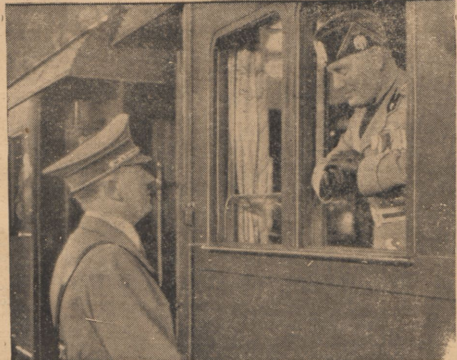
Kancelarz Hitler i Mussolini w chwili odjazdu Mussoliniego z Berlina. Ostatnia rozmowa.