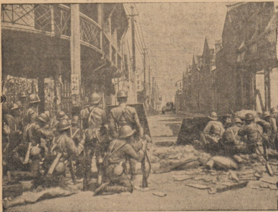
Japońska strefa militarna w Szanghaju.