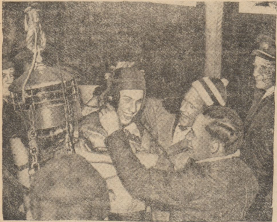
Na jeziorze Miczugań nurek amerykański osiągnął rekordową głębokość 130 m.

Katolicyzm, idea narodowa i organizacja Stron. Narodowego — zwyciężą żydo-komunę