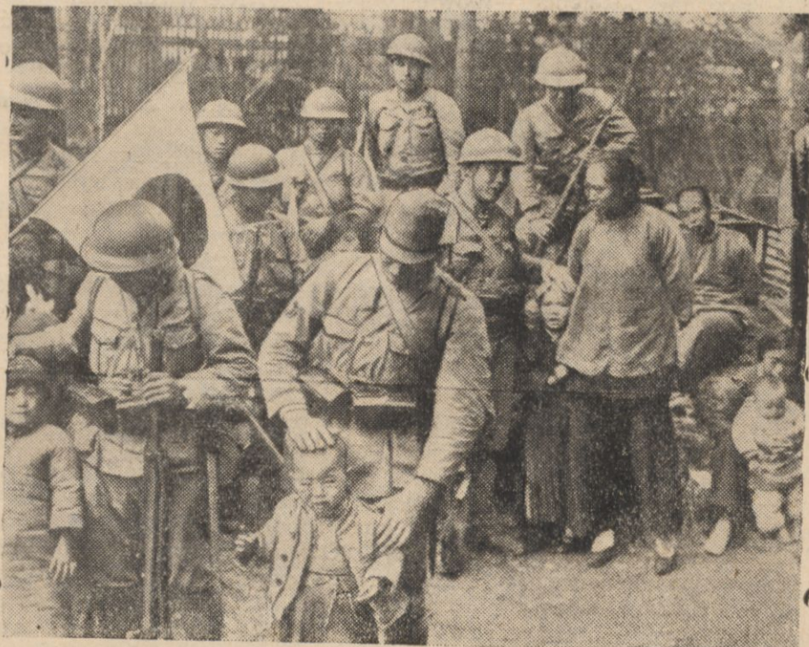
Japończycy opiekują się zbiegami z terenu działań wojennych.