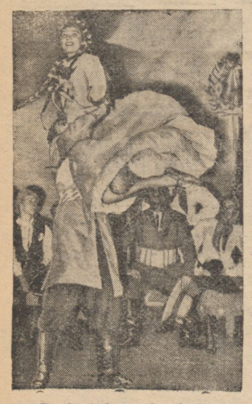
Polski balet w Londynie.