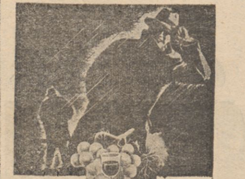
Zonaz, gdy do domu wrócę.....

Całe życie zmarłej było przykła- dem iście samarytańskiego poświęce- nia. Nic też dziwnego, że zgon Jej odbił się szerokim echem tak w kra-