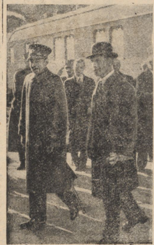
Król grecki z wizytą u ks. Pawła Jugosłowiańskiego.