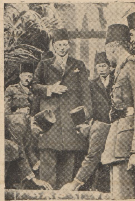
Król Egiptu, Faruk, uduje się na nabożeństwo do meczetu Kehia.

WARSZAWA 21.12. Minister spraw wewnętrznych rozwiązał na terenie całego kraju Niezależną Socjalistyczną Partię Pracy, uznając za organizację nielegalną i zakazał należenia do niej lub współdziałania z nią.