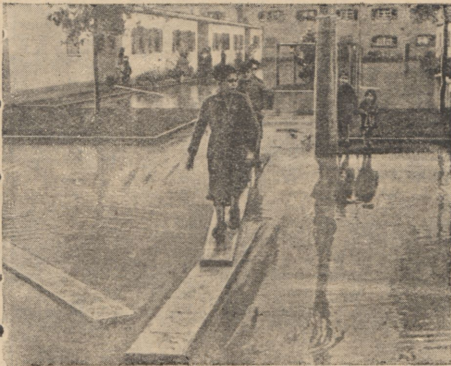
POWÓDZ W RZYMIE.

sensownych straszaków w rodzaju „zeszłowieckiej reakcji” oraz „hulajęcej na ulicach anarchii” starszłacheckiej” znajdowały się również akcenty polityczne. Sprowadzały się one do nawoływania do tworzenia „Polski Ludowej” i do zakresiania o gólnego celu tej Polski.