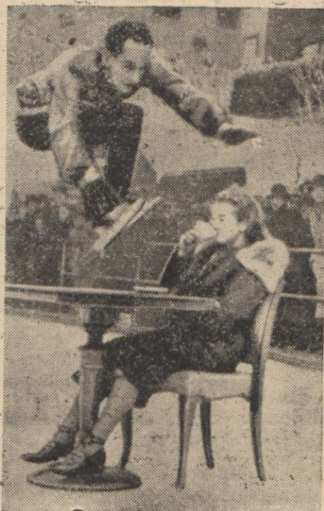
Skok przez stolik.

czelny prezes partii nar.-chrześcijańskiej.