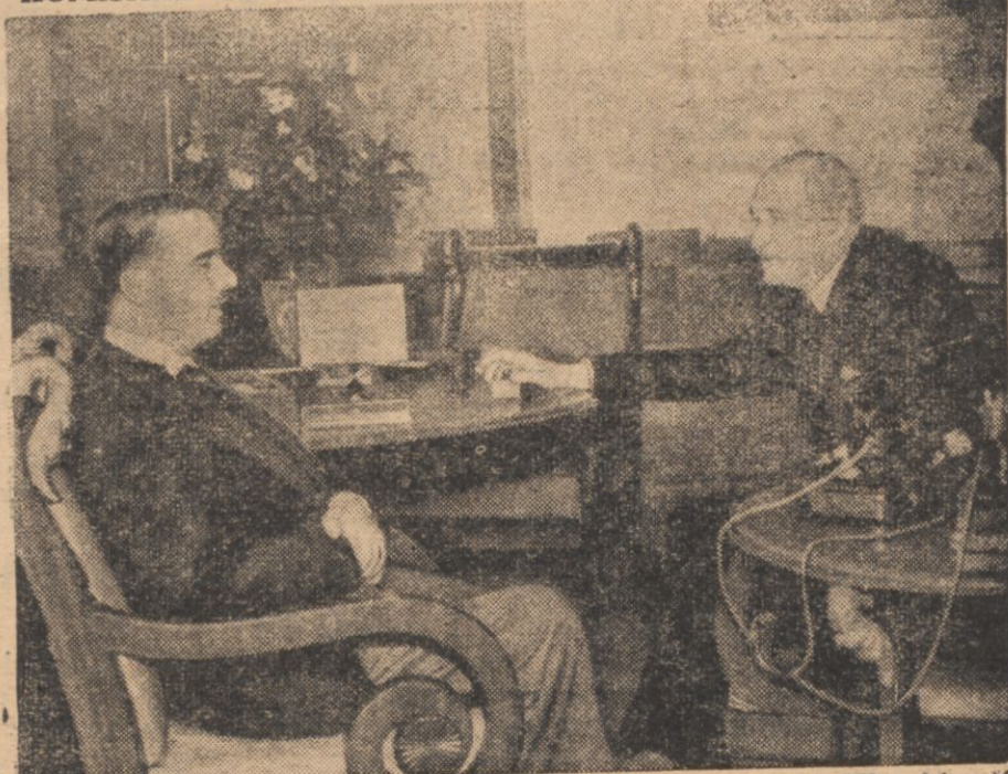
Uczony szwajcarski, prof. Burckhardt, mianowany został Wysokim Komisarzem m. Gdańska i w tym charakterze złożył wizytę Prezydentowi Rzeczypospolitej.