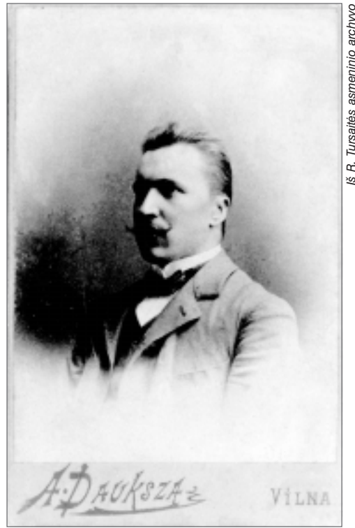
Jonas Vileišis 1902 m.

Man atrodo, jog čia yra taip pat masinės informacijos priemonių, žurnalistų, publicistų, redaktorių darbo trūkumas. Dažnai skundžiamasi, kad nieko nesugebama duoti šviesaus ir gražaus iš dabartinio gyvenimo. To šviesumo ir gražumo ne tiek jau daug ir yra: visi stačia galva