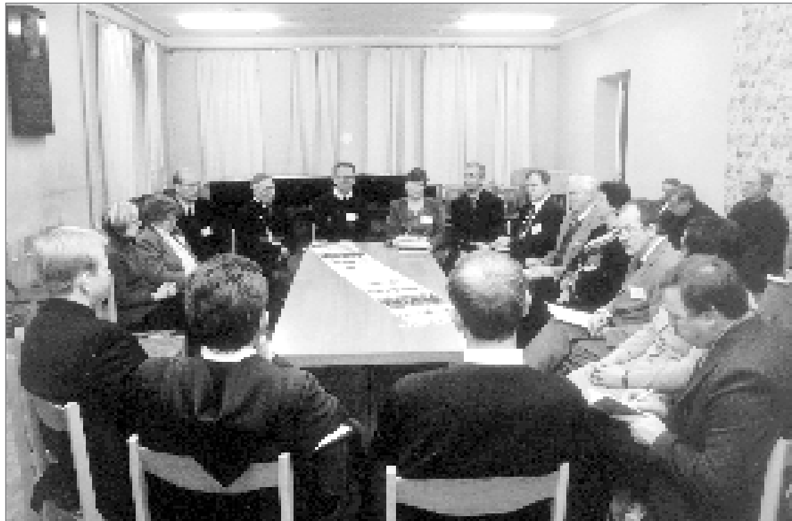
Konrado celėje vyko apvalaus stalo diskusija, skirta bazilijonams

Lapkričio 8-11 d. Šiaulių universitete, Šiaulių rajono Bazilionų vidurinėje mokykloje, Vilniuje Švenčiausios Trejybės bažnyčioje ir greta esančiame vienuolyno pastate vyko tarptautinė mokslinė konferencija Bazilijonai Lietuvoje ir Ukrainoje . Konferencijos rengėjai - Šv. Bazilijaus Didžiojo Ordinas ( Ordo Sancti Basilii Magnum - OSBM ), Lietuvos-ukrainiečių istorikų asociacija ir Lvovo nacionalinio Ivano Franko universiteto biblioteka. Pagrindinis rėmėjas - Tautinių mažumų ir išeivijos departamentas prie Lietuvos Respublikos Vyriausybės. Konferencijos paskaitos įtrauktos į mokymo programas: istorijos mokytojams, išklausiems konferencijos dalyvių pranešimus, Šiaulių universiteto Kvalifikacijos institutas įteikė kvalifikacinius pažymėjimus. Taip pat priminsime, jog ši konferencija surengta minint Švč. Trejybės bažnyčios Vilniuje grąžinimo bazilijonams dešimtmetį.