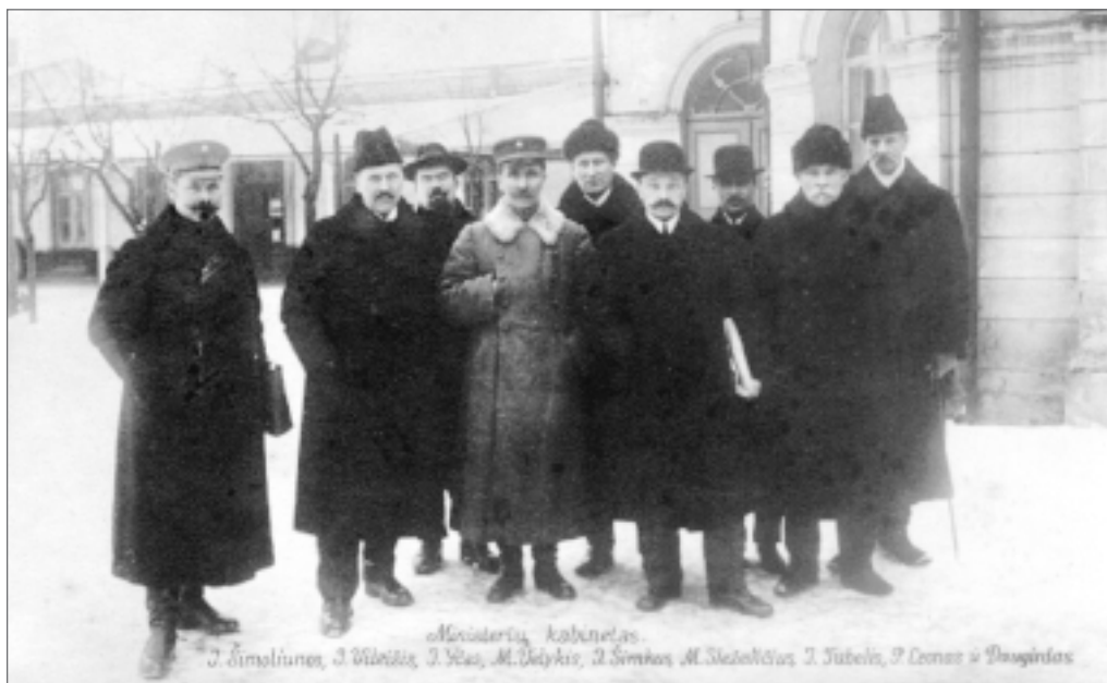
Antrasis ministrų kabinetas (1918 12 26 - 1919 03 12). Iš kairės: Jonas Šimoliūnas, Jonas Vileišis, Jonas Yčas, Mykolas Velykis, Jonas Šimkus, Mykolas Sleževičius, Juozas Tūbelis, Petras Leonas, Tadas Daugirdas