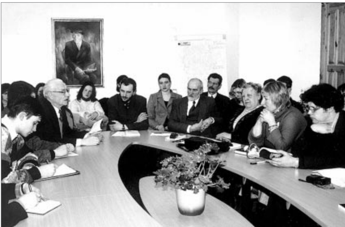
Interdisciplininis seminaras Tekstų skaitymai vyksta Humanitarinio fakulteto Jovaro auditorijoje