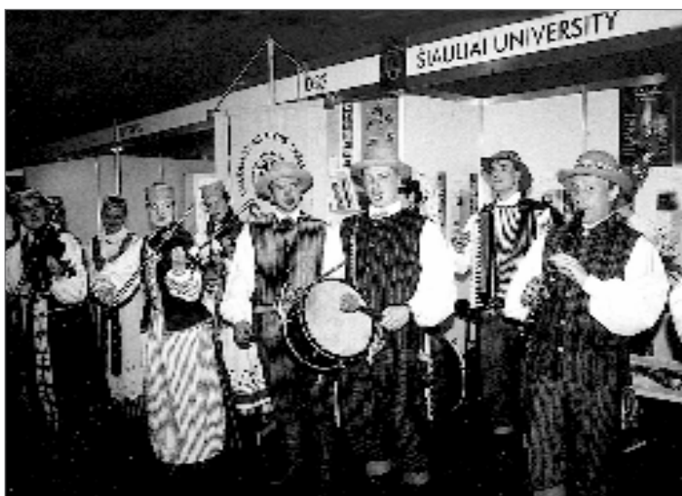
Liaudiškos muzikos ansamblis Saulė