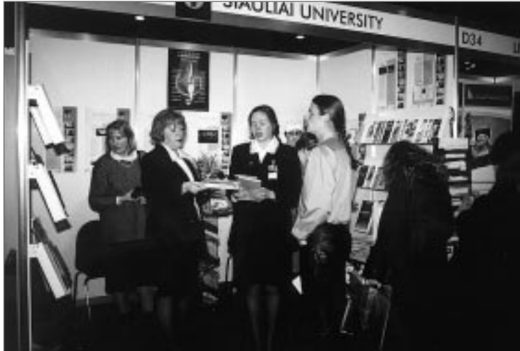
Šiaulių universitetas dalyvavo tarptautinėje parodoje Mokykla 2002, vykusi Rygoje kovo mėn.

Stipriausių studentiško kolektyvų koncertinę veiklą skatina ir visapusiškai globoja Universiteto ir Edu-