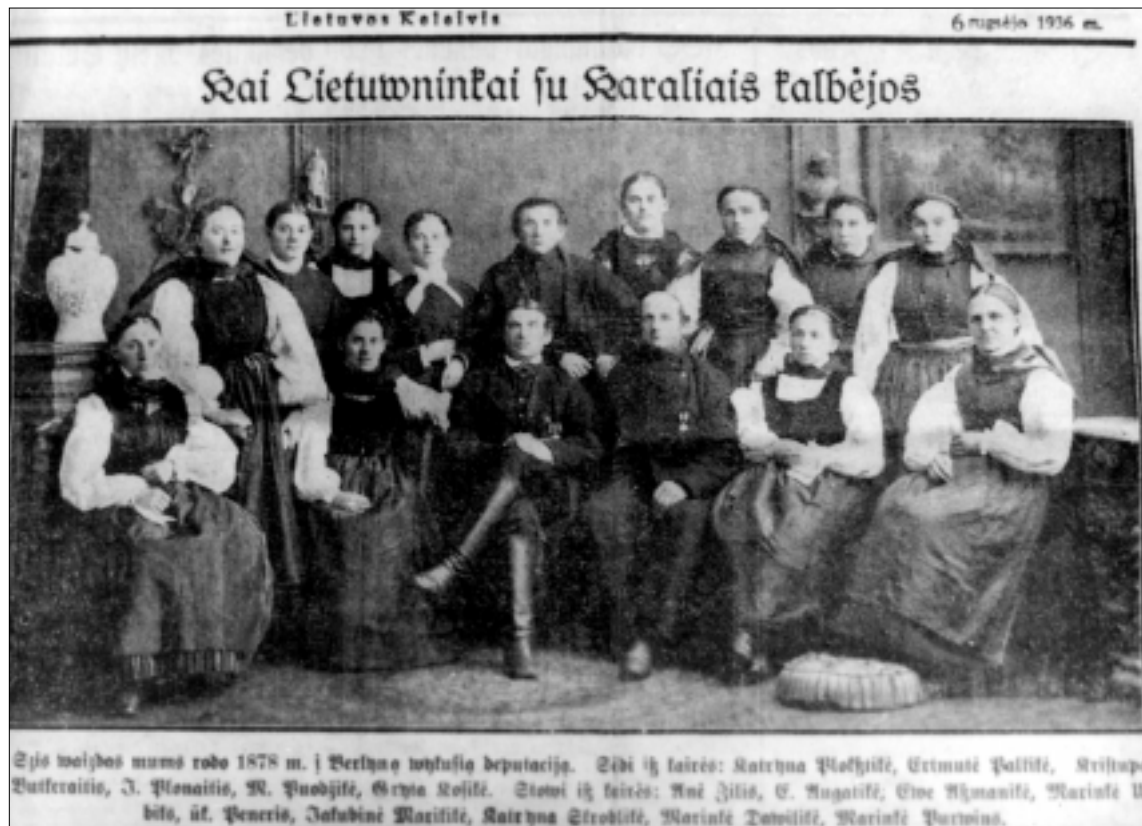
1878 m. deputacijos pas kaizerį Vilhelmą I-į dalyviai.