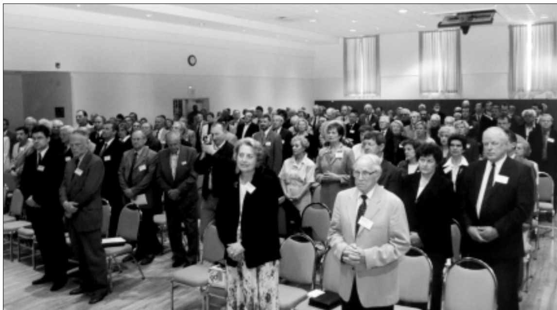
Giedamas Lietuvos himnas

Gyvenau ir aš studijų metais su dviem lenkais, todėl gerai suprantu prof. V. Kavolį. Mūsų santykiuose su lenkais buvo ir kažkas giminiško. Didžiulė neteisybė, kai Europos žemėlapiuose nuo XVI a. žymima Lenkija, o Lietuvos nėra. Bet juk tai buvo ne Lenkija, o Žečpospolita, kurios sudėtyje buvo Lenkijos Karalystė ir Lietuvos Didžioji Kunigaikštystė. Iki pat Žečpospolitos padalinimų buvo išsaugotos visos LDK institucijos. Tik visa bėda, kad valstybėje vyravo len-