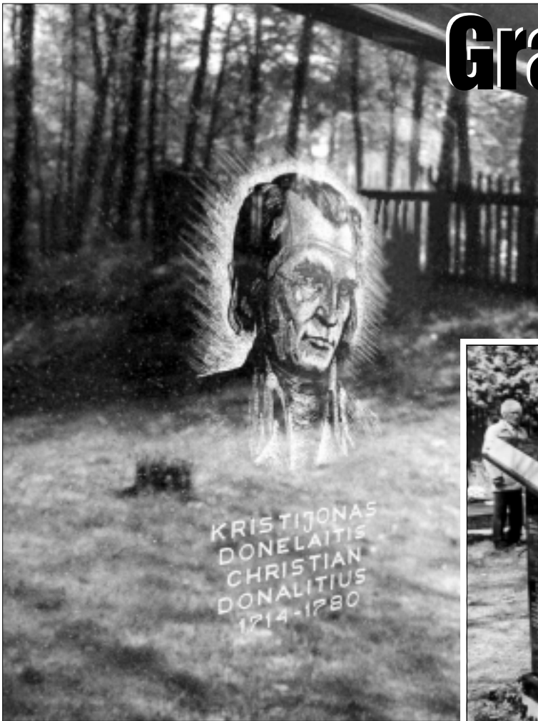
Nuo šiol poeto Kristijono Donelaičio dvasia tvyros Rambyno-Bitėnų kapinėse