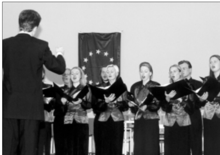
Dainuoja Lietuvos muzikos akademijos vokalinis ansamblis

Nacionalinio susitarimo darbo grupėje man teko ilgai įrodinėti, kad ne prioritetas finansavimas,