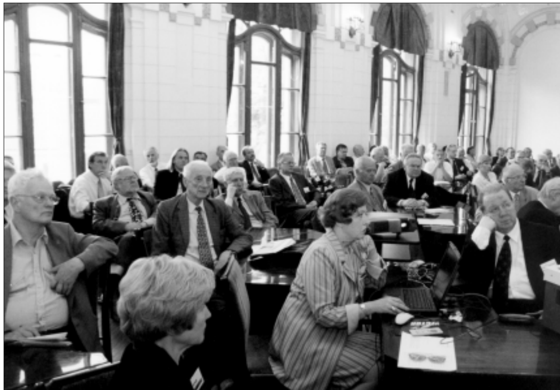
Vyksta Baltijos šalių intelektualinio bendradarbiavimo IX konferencija

Tose šalyse jau kalbama, kad reforma bus gilinama ir tie integruoti institutai greitai jau bus ne juridiniai asmenys, bet virs paprasčiausiais universitetų padaliniais. Kam iš to bus nauda, man sunku spręsti. Ar tai labai didelė reforma ir ar mums reikia mėgdžioti kaimynus? Jeigu latviai ir