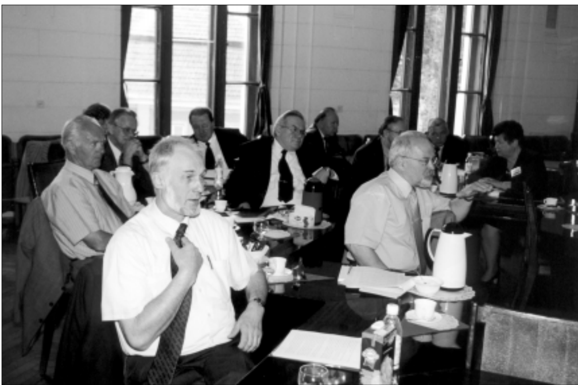
Vyksta Baltijos šalių mokslų akademijų vadovų pasitarimas

Tartu universiteto rektorius I. Avikso pasakojo, kad jų universitetui buvo siūloma integruoti Konkordiją. Bet rektorius pirmiausia nutarė padaryti Konkordijos universiteto auditą, į tą grupę įtraukė ir keletą užsieniečių. Po audito rektorius padarė griežtą sprendimą ir atsisakė į Tartu universiteto sudėtį priimti Konkordiją. Mat