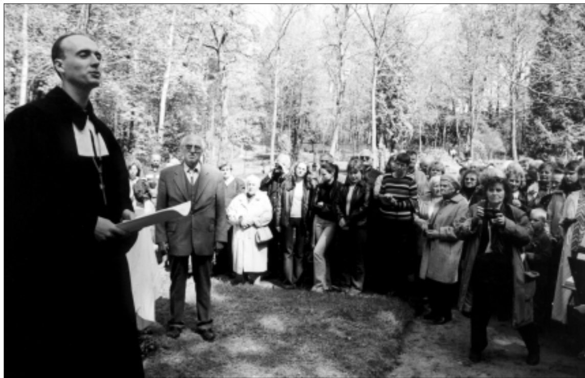
Iškilmų Rambyno-Bitėnų kapinėse akimirka

Kai kurie šio darbo vertintojai nelinkę autoriams atleisti ir už tai, kad minėtas tekstas kairėje lapo pusėje įrašytas vokiškai, o dešinėje – lietuviškai.