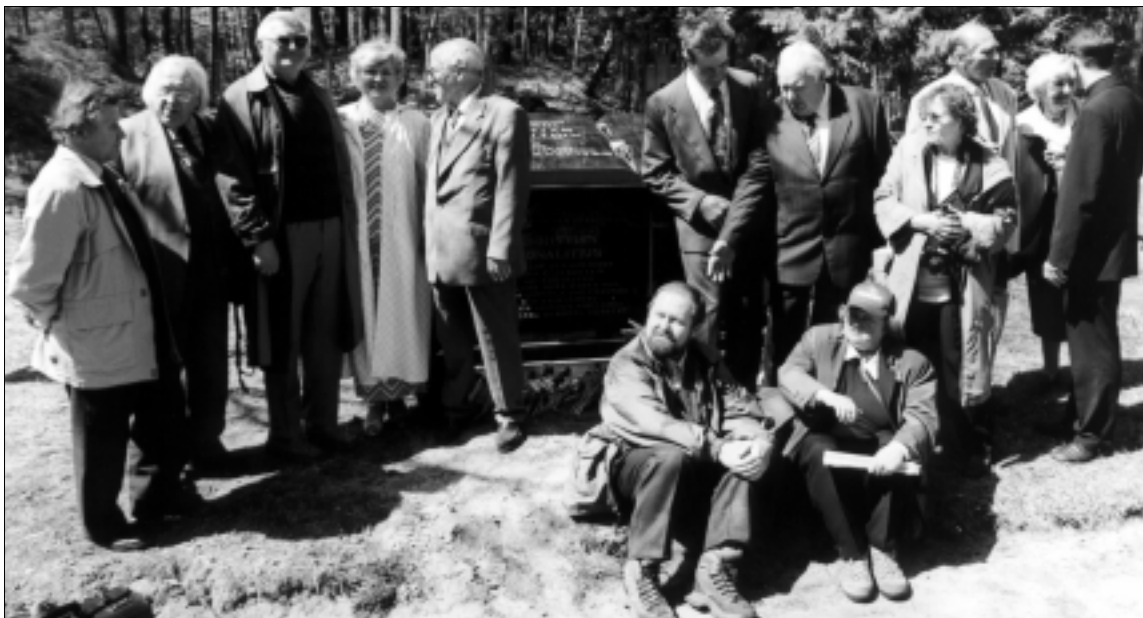
Prie pašventinto paminklo Kristijonui Donelaičiui