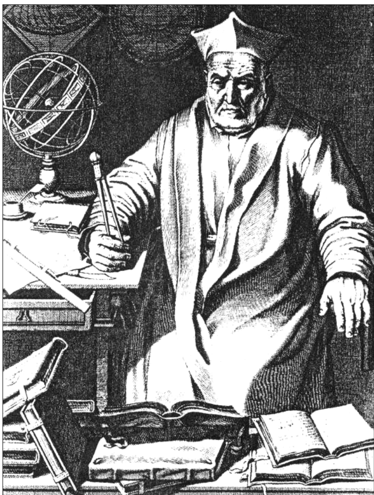
Kristoferis Klavijus – žymiausias XVI a. matematikas – įvykdė kalendoriaus reformą, kurią 1582 m. paskelbė popiežius Grigalijus XIII