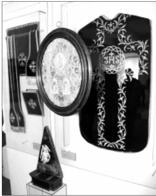
Prabanga tviska bažnytiniai drabužiai

O kaip Lietuvoje? Kad reikia bažnytinio meno muziejaus, bene pirmą kartą buvo prabilta, kai imtas svarstyti ir nacionalinės galerijos klausimas – apie 1921–1922 metus. Bažnyčios vadovybė iš pradžių laikėsi sumanymo kurti atskirą bažnytinės dailės skyrių būsimuosiuose M. K. Čiurlio-