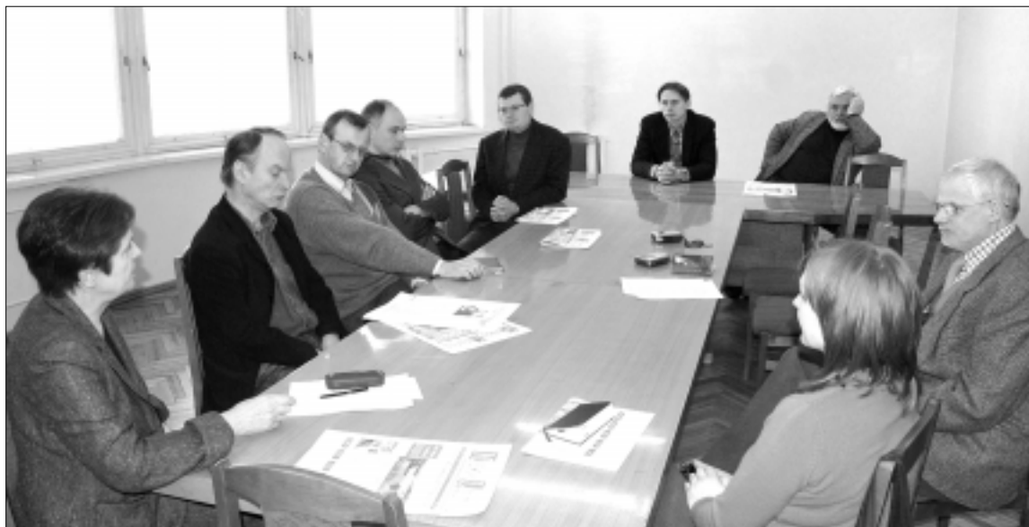
Lietuvos istorijos institute nagrinėjama „Lietuvos istorijos“ projektą

ziaumą vyriausiajai redaktorei tektų nukreipti griežta numatyto darbo kryptimi, nes bus siekiama visų 13 tomų veikalų vientisumo, visumos.