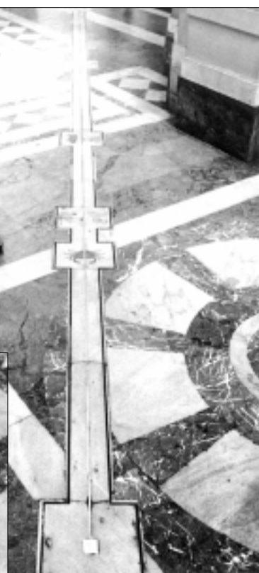
Saulės meridianas Duomo katedroje Palerme (Sicilijoje)

Jis parodė, kaip negailestingai Romoje, Romos kolegijoje saugomas egzempliorius buvo jėzuitų indekso cenzorių išbrauktas. Juodu tušu perbrauktų eilučių neįmanoma išskaityti. Laimė, toli nuo Ro-