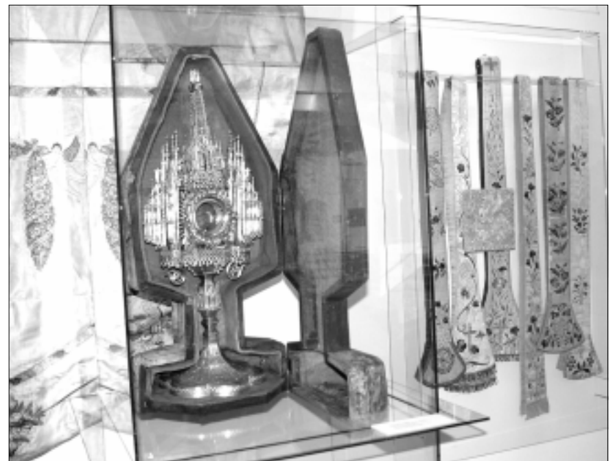
Vidiškių Švč. M. Marijos Apsilankymo bažnyčios turtas – monstrancija su dėklu. Vilnius, M. Nieviadomskio dirbtuvė, apie 1904 m. Sidabras, liejimas, graviravimas, kalstymas, auksavimas; dėklas – medis, dirbtinė oda, medvilninis audinys