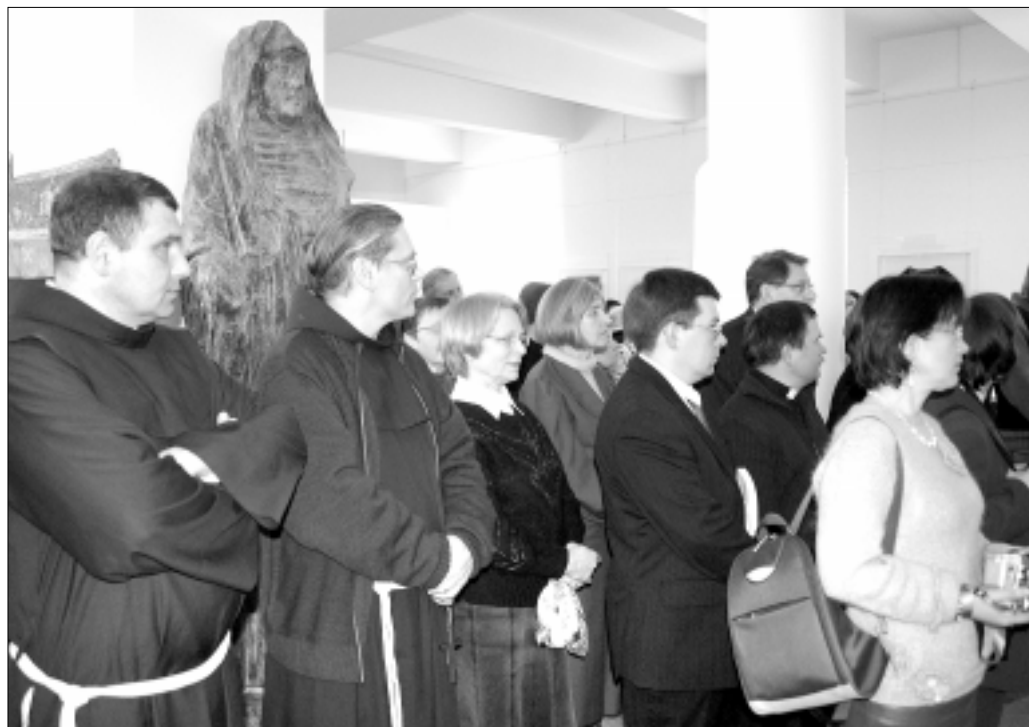
Bažnytinio meno paveldas aktualus ir pasauliečiams, ir religinių bendruomenių žmonėms

Bažnytinių muziejų kūrimosi epocha – XIX a., tiksliau to amžiaus pabaiga, kai prasidėjo tikras bažnytinio meno muziejų steigimo sąjūdis. Tyrinėtojai išskiria dvi šio reiškinio sąlygas – tai dar Švietimo epochos sukeltas žinių poreikis, kuris XIX a. siejosi su romantizmo pažadinta meile praeičiai, istorijai. „Griuvusių romantika“ ir žinių poreikis žmones skatino labiau domėtis kultūros paveldu, senovės paminklais. Tą domėjimąsi skatino ir tuo metu Europoje išplitusi mada keliauti. Prancūzija, Vokietija, Austrija, Didžioji Britanija, o joms įkandin ir kitos šalys susirūpino kultūros paminklų apsauga, restauravimu bei globa. Buvo suformuluotos nekilnojamųjų ir kilnojamųjų vertybių sąvokos. Kilnojamąsias vertybes imta kaupti viešuose muziejuose, valstybės rinkiniuose. Prisiminti ir Katedrų lobynai, kurių durys būtent XIX