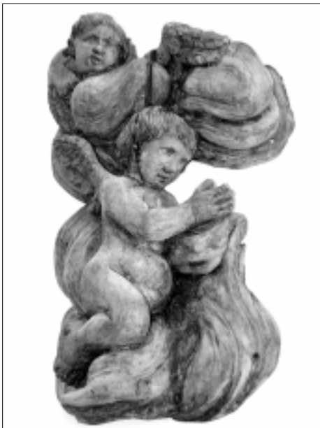
Bažnytinio paveldo muziejaus inauguracinės parodos eksponatas

Kovo 8-ąją Lietuvos nacionaliniame muziejuje, Naujajame arsenale, atidaryta Bažnytinio paveldo muziejaus inauguracinė paroda, kurią muziejus surengė kartu su Vilniaus arkivyskupijos kurija.