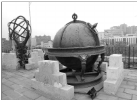
Jėzuitas Ferdinandas Verbiestas nuliejo žalvarinius astronomijos instrumentus Pekino observatorijai

Galilėjo Galilėjaus (Galileo Galilei, 1564–1642 m.) atradimus teleskopu, pirmavo teleskopų gaminimo srityje, dovanojo teleskopą Johanui Kepleriui (Johannes Kepler, 1571–1630 m.). Jie astronomijos mokslą perkėlė į Kiniją ir 200 metų jį ten dėstė. 1673 m. Ferdinandas Verbiestas (Ferdinand Verbiest, 1623–1688 m.) Kinijoje nu-