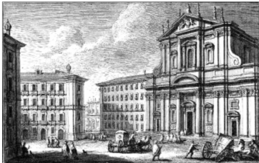
Romos kolegija (Collegio Romano) – didysis matematikos centras. Čia XVI a. dėstė Kristofelis Klavijus ir kiti žymūs jėzuitai

Galilėjo Galilėjaus (Galileo Galilei, 1564–1642 m.) atradimus teleskopu, pirmavo teleskopų gaminimo srityje, dovanojo teleskopą Johanui Kepleriui (Johannes Kepler, 1571–1630 m.). Jie astronomijos mokslą perkėlė į Kiniją ir 200 metų jį ten dėstė. 1673 m. Ferdinandas Verbiestas (Ferdinand Verbiest, 1623–1688 m.) Kinijoje nu-