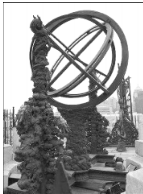
Jėzuitų palikimas Pekino observatorijoje