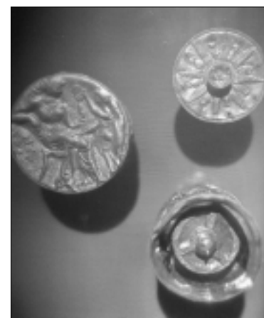
Hologramoje – piksidai; tai auksinės gausiai ornamentuotos dėžutės, kuriose buvo laikoma kosmetika (IV a. pr. Kr.)

Verslui plėtoti tinka ne tik sostinė Verslui nereikia trukdyti. Mūsų verslininkai labai sėkmingai vieni kitus susiras ir puikiai bendradarbiaus. Tad ką čia gali gero padaryti politikai? Mūsų užduotis – toms geroms iniciatyvoms sukurti patikimą politinę šią