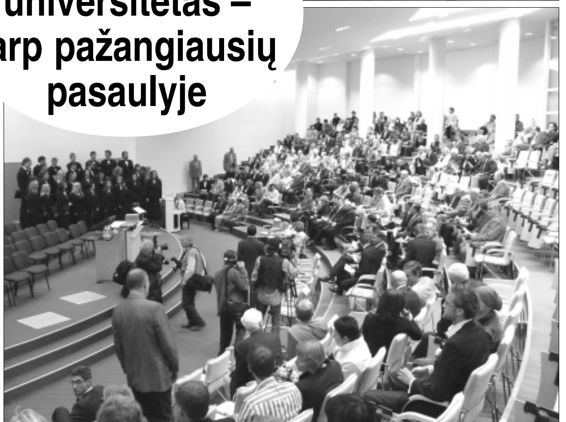
Gausybė garbių svečių – mokslininkų, politikų, visuomenės veikėjų – tą dieną apsilankė Mykolo Romerio universiteto naujuosiuose rūmuose