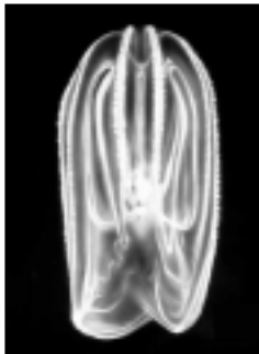
Medūzos „Mnemiopsis leidyi“ Juodosios jūros ekosistemoje užima kilkių vietą

Proceedings of the National Academy of Sciences