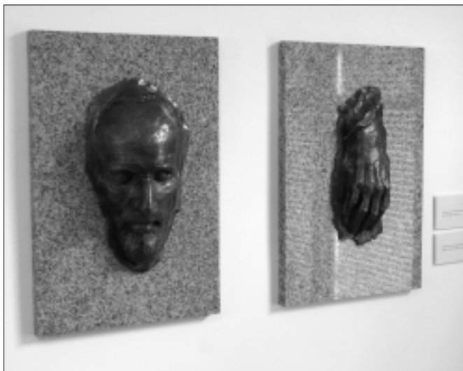
Vaikaičių užsakymu iš bronzos išlietos pomirtinės prof. Mykolo Biržiškos veido ir rankų kaukės