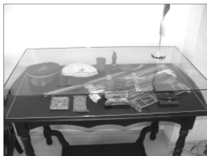
Asmeniniai Mykolo Biržiškos daiktai – apdovanojimai, rašikliai, studentų korporacijų, kurių nariu arba garbės nariu buvo profesorius, kepuraitės