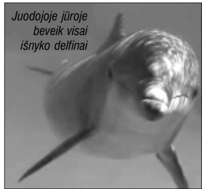
Juodojoje jūroje beveik visai išnyko delfinai

2005 m. Europos aplinkos apsaugos agentūra savo ataskaitoje pažymėjo, kad kartais šios medūzos jau sudaro 90 proc. visų Juodosios jūros organizmų gyvosios masės. Kodėl taip yra? Anksčiau manyta, kad medūzos tiesiog išstūmė žuvį. Tačiau britų tyrinėtojai priėjo išvadą, jog dėl žuvies išnykimo kalte turi prisiimti žmogus, o medūzos tiesiog užpildė atsilaisvinusią ekologinę nišą.