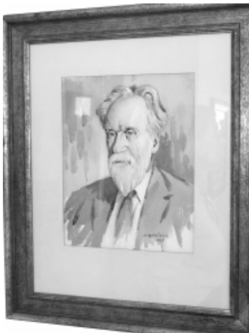
Mykolas Biržiška – viena iškiliausių lietuvių tautos asmenybių