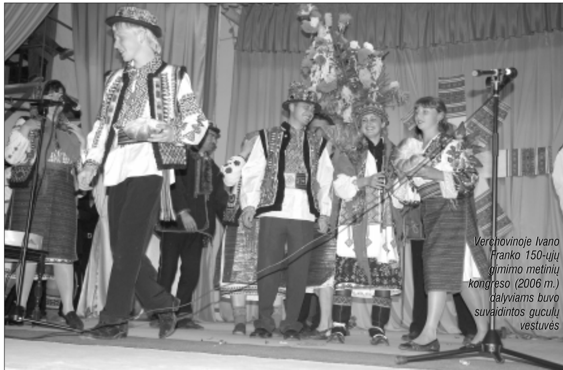
Verchovinoje Ivano Franko 150-ųjų gimimo metinių kongreso (2006 m.) dalyviams buvo suvaidintos guculų vestuvės

11 d. Vilniuje, kai vyks viršūnių susitikimas. Visi projektai, kuriuos čia prisiminėme – mūsų bendro darbo projektai.