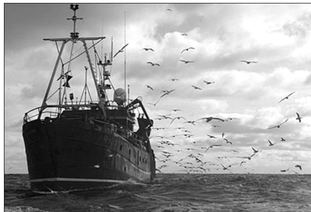
Europos jūrose ekologinė padėtis vis blogėja

Mokslininkai tyrinėjo, kaip jūras veikia šie veiksniai: europiečių gyvenimo būdo pokyčiai, intensyvus žuvų auginimas gėluosiuose vandenyse, cheminė tarša ir pramoninė žvejyba. Prof. L. My teigimu, visi šie veiksniai tarpusavyje glaudžiai susiję. Daug įtakos turi Eu-