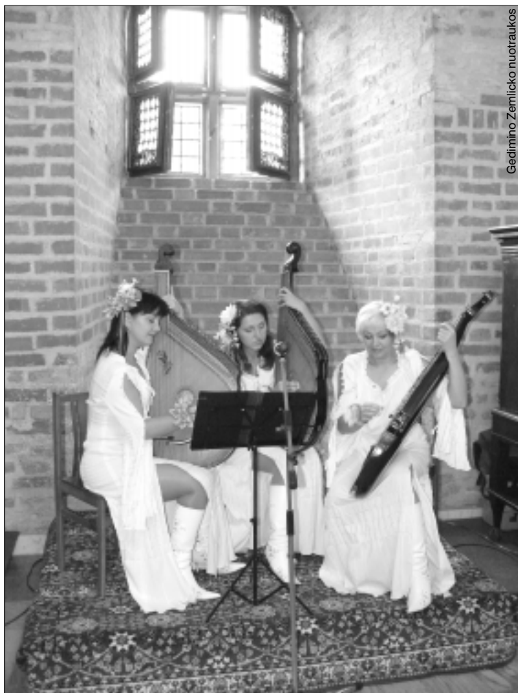
Renginio metu koncertavo bandūrisčių trio „Lelija“ iš Volynės

zidentų susitikimo Kijeve metu, ji plėtota ir šiemet vykusiame susitikime Krokuvoje. Šių metų spalio 10–11 d. apie tai bus diskutuojama Vilniuje labai aukštu lygiu.