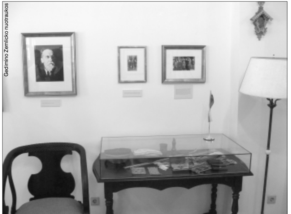
Mykolo Biržiškos memorialinio kambario ekspozicijos dalis

Po M. Biržiškos mirties jo darbo kambarys ilgai buvo neliečiamas, bet profesoriaus vaikaičiai jaučia pareigą M. Biržiškos archyvą ir daiktus atiduoti Lietuvai. Dar kai buvo gyva