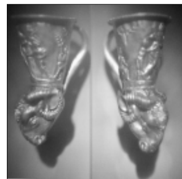
Hologramose – ritonai; auksiniai ritualiniai skitų indai, kurie buvo naudojami broliavimosi ritualui (IV a. pr. Kr.)