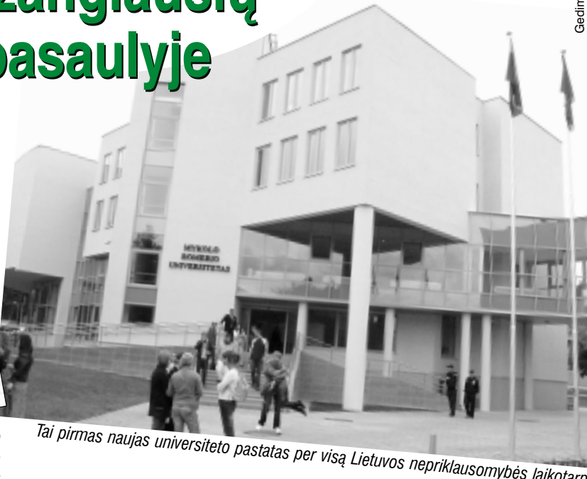
Tai pirmas naujas universiteto pastatas per visą Lietuvos nepriklausomybės laikotarpį