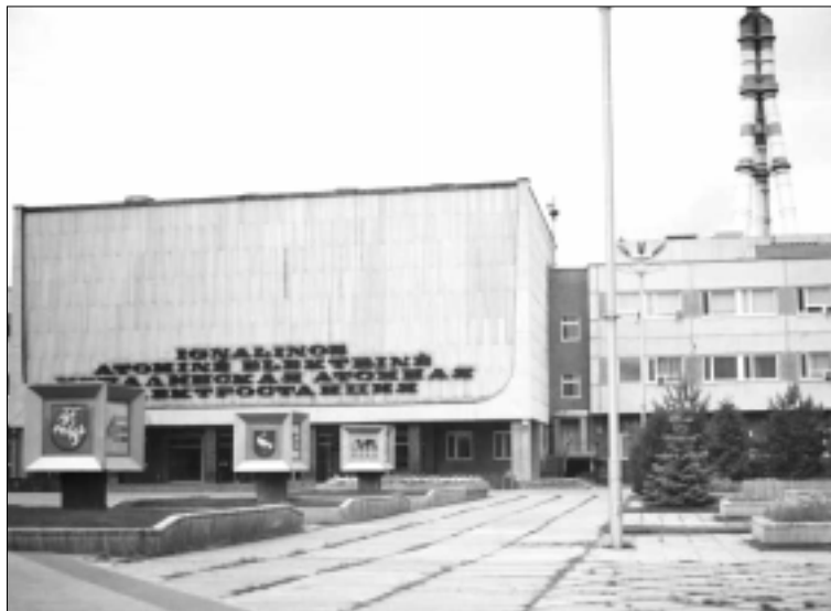
Ignalinos atominė elektrinė

Tik daugiau kaip 30 Seimo narių susilaikė balsuojant dėl Ignalinos AE antrojo blokų darbo pratęsimo. Tai rodo Seimo kaip institucijos neapsisprendimą ir neryžtingumą šiuo strateginiu mūsų