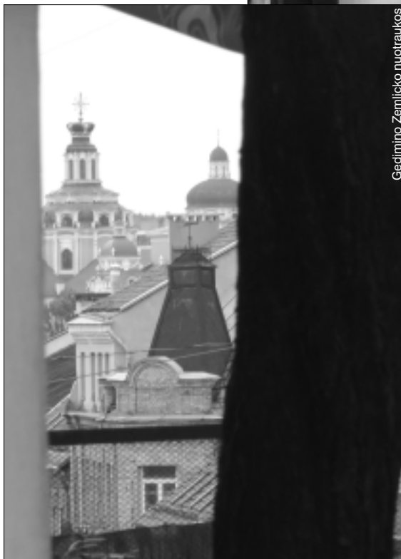
Iš čia, kur dabar stovi skulptūra, atsiveria senoji Vilniaus bokštai

kad jiems abiem teko idėti labai daug pastangų stengiantis prisijaukinti bent kokią įnoringą mūžą. Smuikas atkrito per tris savaites, šokėju taip pat netapo, nors ne dėl Romano, bet daugiau dėl paties mokytojo problemų. Tąpa netiko jau vien dėl to, kad dailininko laukė nepripažinimas, badmiriavimas ir nesibaigiančios girtuokly-