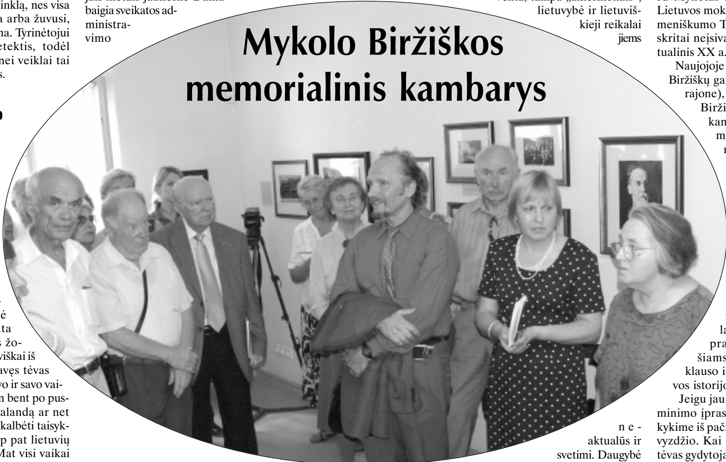
Atidarant Vasario 16-osios Nepriklausomybės akto signataro prof. Mykolo Biržiškos memorialinį kambarį

magistro studijas Jeilio universitete ir žada tęsti medicinos studijas. Abi dukros šiek tiek moka lietuviškai, norėtų padirbėti Lietuvoje.