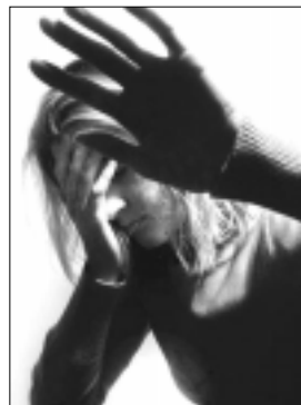
Rimonabantas skatina depresiją

JAV Maisto ir vaistų administracija taip pat nustatė, kad viršsvorio turintys žmonės ir taip gana dažnai puola į depresiją ir galvoja apie savižudybę, tad labai pavojinga šią riziką didinti vartojant minėtus vaistus. Kitas mokslininkų tyrimas parodė, kad savanoriai, kurie kasdien išgerdavo po 20 mg rimonabanto, ėmė skųstis nemiga, juos kankino nerimas ir panikos priepuoliai, o tie, kurie gaudavo placebo tablečių, nieko panašaus nepatyrė.