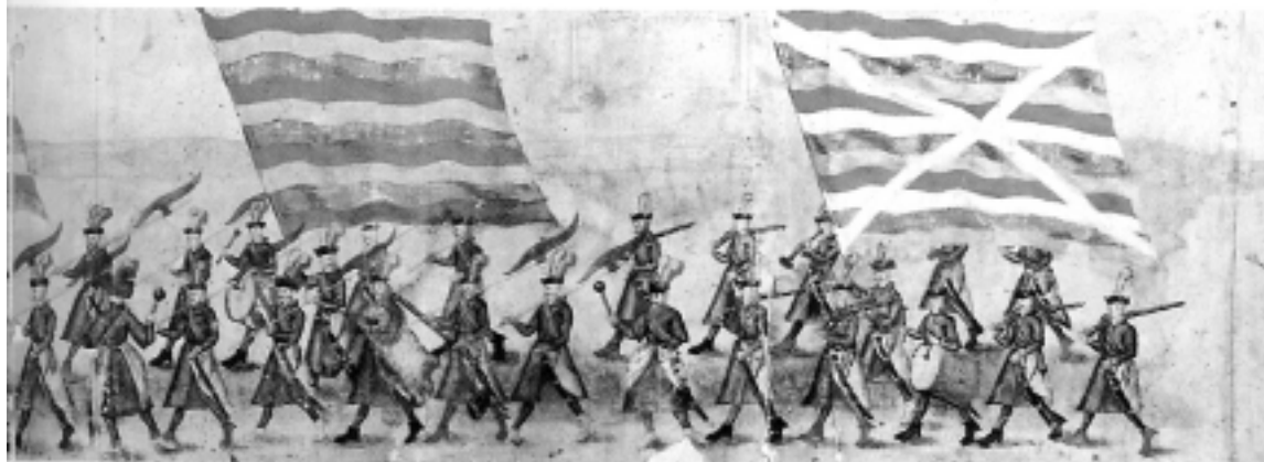
LDK kariuomenės vėliavos. 1605 m. nežinomo dailininko spalvinė kompozicija, kurioje vaizduojamas jungtinės Lietuvos ir Lenkijos kariuomenės paradas, skirtas Žygimanto III ir Konstancijos Austrijietės vestuvėms bei įvažiavimui į Krokuvą

gubąjį kryžiaus menko pažinimo iki šiol tarsi negali pajudėti iš pradinės padėties, nes tyrinėtojai nepajėgia paaiškinti simbolių reikšmės ir jų kilmės. Tačiau blogiausia, kad diskusijos ir ginčai kyla ne dėl dalyko esmės ir ne dėl simbolių prasmės, o dėl to, ką vienas ar kitas tyrinėtojas parašė. Kartais net apsižodžiaujama, apsieikiama ne visada draugiškai paleistomis strėlėmis. Pagrindinė problema taip ir lieka nuošalėje. Heraldikos specialistams šis kryžius irgi sudaro papildomų sunkumų, jie taip pat nėra išigilinę į šio kryžiaus specifiką, todėl neišvengia daugybės netikslumų. Dalis lietuvių tyrinėtojų, neturėdami savo nuomonės tuo klausimu, vadovaujasi kitų šalių mokslininkų pateiktomis versijomis. Pavyzdžiui, dalis numizmatų remiasi Baltarusijos, Lenkijos ir Rusijos, heraldikos tyrinėtojų – jų suformuluotais teiginiais ir net nebando ieškoti savo dvigubąjį kryžiaus pažinimo kelio. Kiek tų baltarusiškų, lenkiškų versijų jau buvo? Kiek jų dar bus, o savas išvadas dėl simbolių kilmės formuoti sekasi sunkiai, kol kas tvirtesnės nuomonės tuo klausimu neturime nė vienos.