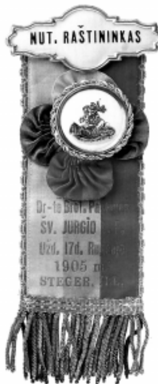
JAV lietuvių Šv. Jurgio draugijos ženklas, 1905 m.

Vienokio ar kitokio žiaurumo apraiškų buvo kiekvienoje Europos tautoje. Ir ne vien tik priešai padarė vyskopus ir misionierius nemarius. Jų pačių pasiryžimas aukotis ir mirti už jų išpažintą tikėjimą buvo tam tikru pasišventimo pavyzdžiu, patraukiančiu prie tikėjimo vis gausesnį tikinčiųjų būrį. Pasiuntus į amžinybę kitos religijos skleidėjus, vienaip ar kitaip vėliau už tą žiaurumą buvo atgailaujama, kankinių atminimą įprasmindavo statydami paminklus, skelbdami juos šventaisiais. Lietuvoje šiemet minimi Šv. Brunono žūtį, bet net kryželio nesame pastatę. Nebent dar bus susiprasta tai padaryti. Kaune stovintis Pažaislio vienuolynas ir bažnyčia, kurie galbūt net tiesiogiai vienu ar kitu būdu yra susiję su šiuo įvykiu, nuo visos planuojamos šventinės programos stovi tarsi nuošaliai. O juk Pažaislis yra vienintelė vieta Lietuvoje, kur ši istorija plačiausiai atspindėta freskose. Tad šiais metais visų lietuvių pareiga – aplankyti Pažaislį, taip pat pasidairyti į bažnyčios skliautuose užfiksuotą mūsų tūkstantmečio istorijos palikimą, maldomis prisiminti nekaltai nužudytąjį taikios krikščioniškos misijos vyskupą, jo bendražygius ir visą mūsų tautos kelią prie Tikrojo kryžiaus.