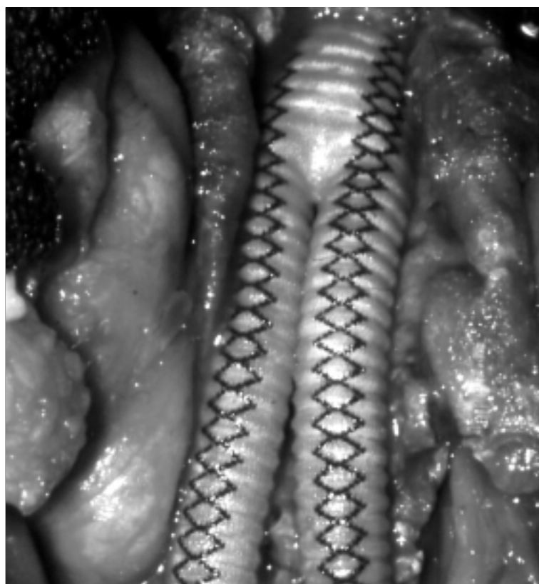
Kraujagyslės protezas, įsiūtas vietoje pašalintos pilvo aortos aneurizmos