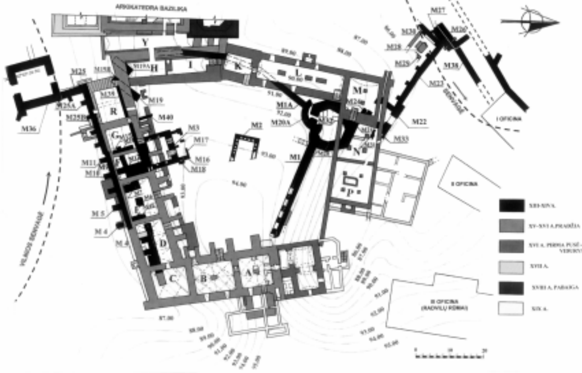
Lietuvos didžiųjų kunigaikščių rezidencijos (Valdovų rūmų) rūsių planas (pagal 1987–2007 m. tyrimų duomenis)

Baltiškasis plytų perrišos būdas mūsų restauratoriams Žemutinės pilies teritorijoje buvo žinomas ir anksčiau, kai 1963 m. po Katedros Varpinė buvo surasta keturkampė dalis su baltiškąja plytų perriša. 1964 m. prie buvusių Pionierių rūmų (buvusių Valdovų rūmų rytinė dalis, išlikusi XIX a. pradžioje pastatyta vadinamajame Šliosbergo name) tiesiant šiluminę trasą (mūsų plane vadinama M1 siena)