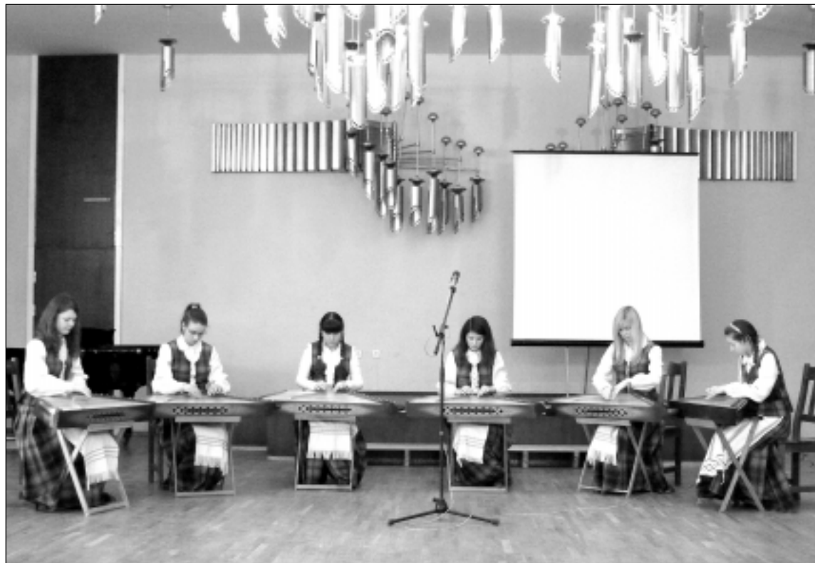
Jaunosios Kupiškio kanklininkės

Kuo ši pelkė ypatinga? Dageiliu aspektu. Pirmiausia nežinančiam, nepatyrusiam žmogui tai pavojinga vieta, bent jau tokia yra buvusi praeityje. Pelkės paslaptys žadino vaizduotę, ji apipinta legendomis, šiurpėmis, kurios juk ir pasa-