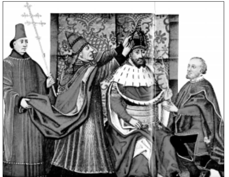
Karolio Didžiojo karūnavimas. Senovinis paveikslas

Vadinasi, per šimtmečius ir net LDK įėjus į carinės Rusijos sudėtį tas supratimas, šiandien gal pasakytume, taip pat ir spalvų prasmės svarba nebuvo pamiršta. Veikiausiai glū-