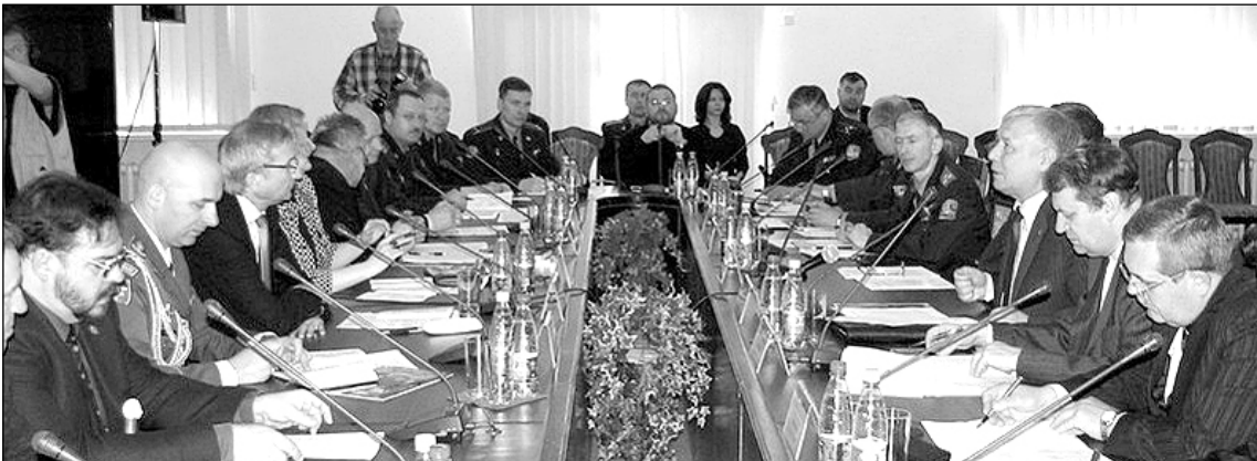
Kijeve vykusioje apskritojo stalo diskusijoje aptarta Mėlynųjų Vandenų mūšio reikšmė Lietuvos ir Ukrainos istorijai

Ukrainos nacionalinėje gynybos akademijoje Kijeve balandžio 7 d. vyko apskritojo stalo diskusija, kurioje buvo aptariama Mėlynųjų Vandenų mūšio (1363 m. Lietuvos Didžiojo kunigaikščio Algirdo vadovaujama kariuomenė, sudaryta iš lietuvių, ukrainiečių ir baltarusių padalinių, nugalėjo totorius) reikšmė Lietuvos ir Ukrainos istorijai.