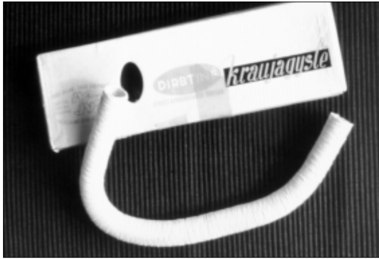
Lietuviška dirbtinė kraujagyslė, Kauno „Kaspinas“ 1960 m.