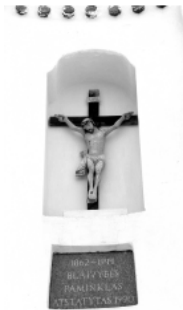
Kupiškio krašte, Skapiškyje, dar vyskupo Motiejaus Valančiaus laikais stovėjusios blaivybės koplytėlės fragmentas (koplytėlė atkurta 1990 m.)

Kalbama, kad senovėje toje vietoje tyvuliavęs ežeras, stovėjęsi bažnyčia, bet vieną dieną prasmeji skradžiai kartu su visais žmo-