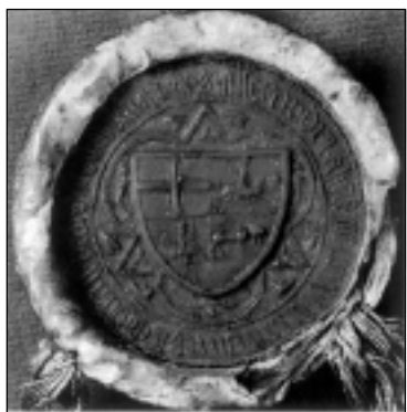
Didysis Vytauto antspaudas, 1404 m.

Mano siekis ir buvo surinkti kuo daugiau medžiagos, išjudinti susidomėjimą dvigubuoju kryžiumi, problemą išskirti iki diskusijos lygmens, kad pagaliau apie tai būtų pradėta kalbėti. Simbolis labai svarbus mūsų heraldikai, sfragistikai, numizmatikai, be to, jis plačiai naudojamas valstybės tradicijose ir yra žmonių labai mėgiamas ženklas, de ja, dar labai mažai pažįstamas. Lietuvos numizmatika ir sfragistika iš dalies dėl simbolių, taip pat ir dvi-