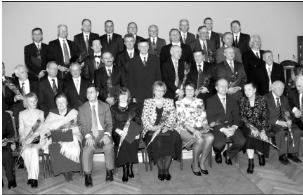
Dalis 2008 m. Lietuvos mokslo premijų laureatų kartu su LR Ministru pirmininku Andriumi Kubiliumi bei švietimo ir mokslo ministru Gintaru Steponavičiumi

būsimumų fizikų smegenėlės taip būdavo surikiuojamos, kad į alchemikų ar balanos gadynę jie nei patys nesiveržia grįžti, nei savo tautiečius vilioja.