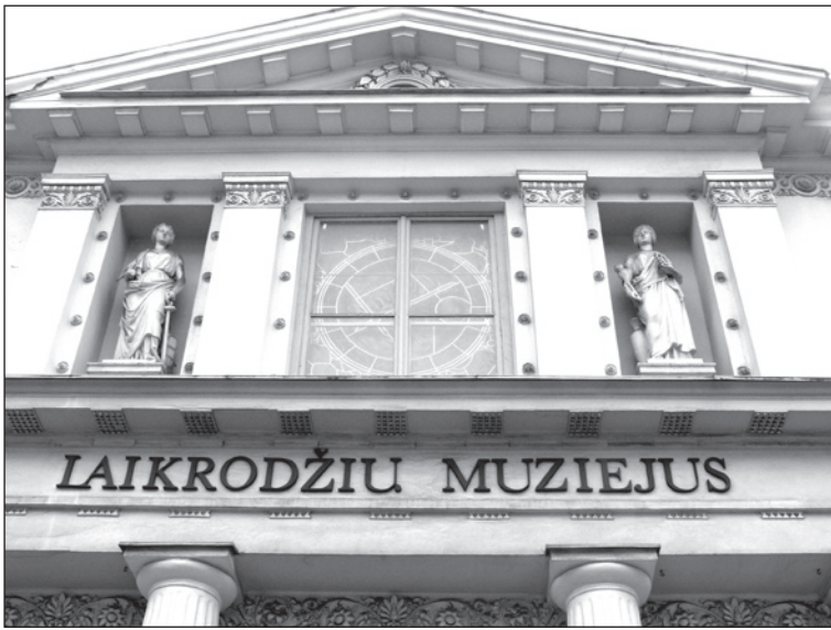
Klaipėdos laikrodžių muziejus taip pat įsikūręs Liepų gatvėje