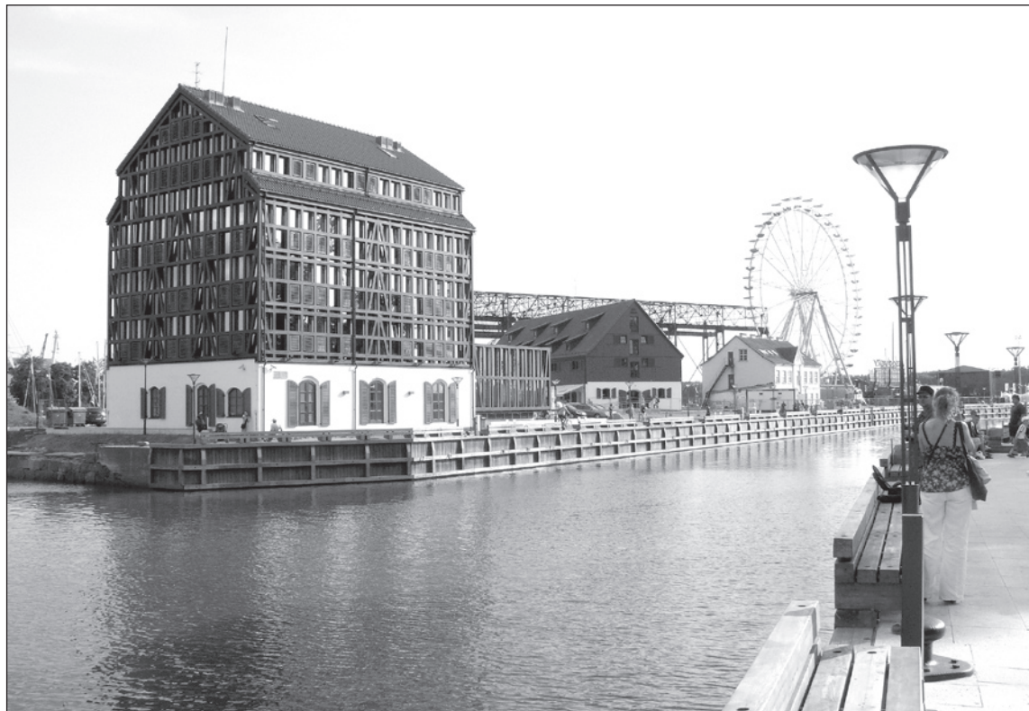
Retai kada galima išvysti tokį vaizdą, kad Danės upės neraižytų laivai laiveliai

Matyt, XVIII a. pabaigoje ar XIX a. pradžioje per Žasų turgų nutiesta antra tranzitinė gatvė, lygiagrečiai Žardžių gatvei. Apsodinta liepomis, o leidus statyti gyvenamuosius namus ėmė formuotis viena