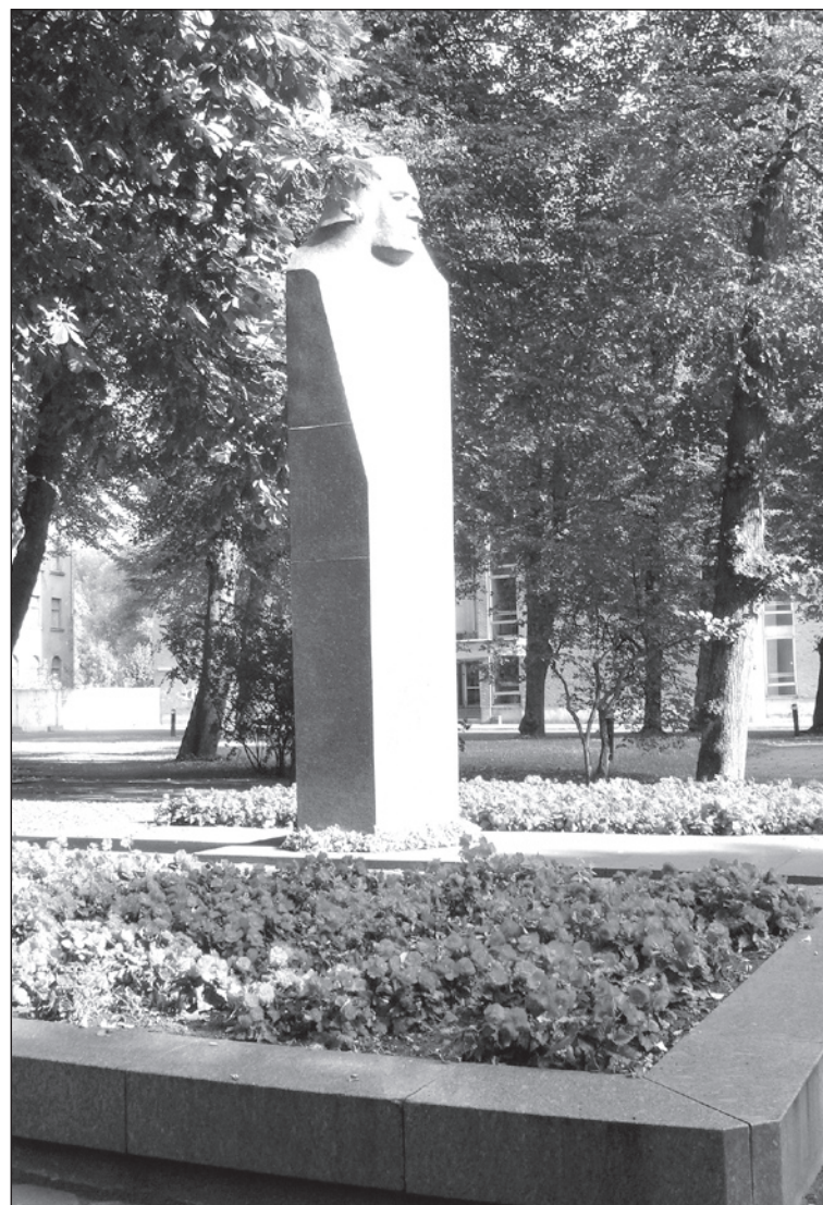
Kaip ir kasmet sausio 1 d. 12 val. prie šio paminklo rinksis klaipeidiečiai