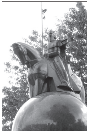
Karys budi Lietuvos sargyboje

Nuo 1923 m., kai Klaipėda tapo Lietuvos miestu, gatvių pavadinimai