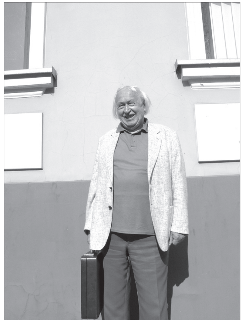
Prie šio verslo centro Liepų gatvėje netrukus iškils paminklas J. Zauerveinui