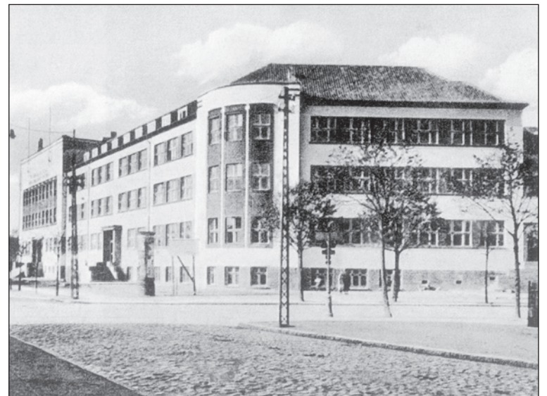
Vytauto Didžiojo gimnazija Klaipėdoje, S. Daukanto g. Nr. 11