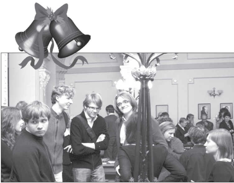
LMA specialiojoje sesijoje „Mokslas: kartų ryšys“