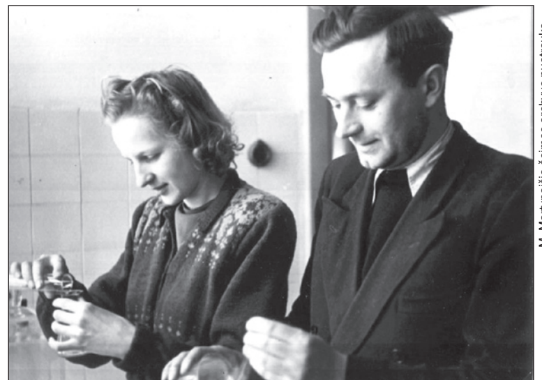
Moksliniai tyrimai studijų laikais