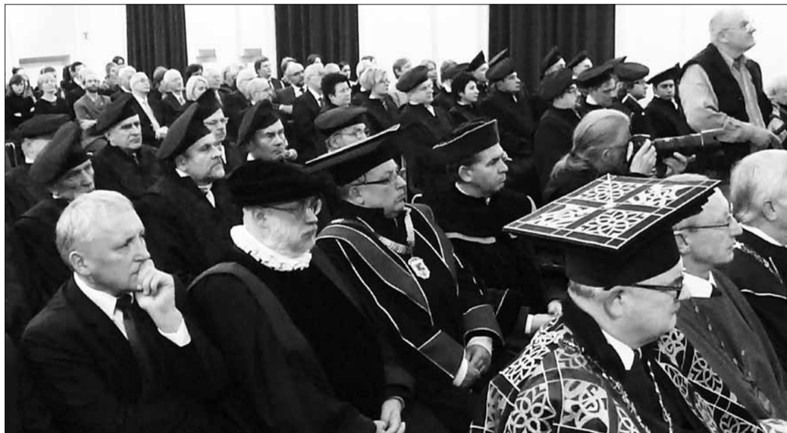
Kauno technologijos universiteto Senato nariai ir bendruomenės nariai, Lietuvos universitetų rektoriai ir šventinio renginio svečiai klausosi KTU rektoriaus prakalbos

Stažavosi Aberdino universitete (Didžioji Britanija, 1990–1991), vėliau vadovavo keliems projektams Didžiojoje Britanijoje. Nuo 1992 m. Tarptautinės integracijos centro „Baltoskandija“ direktorius. 1994–1997 m. atstovavo Danijos industrijos konfederacijai Lietuvoje, jam vadovaujant,