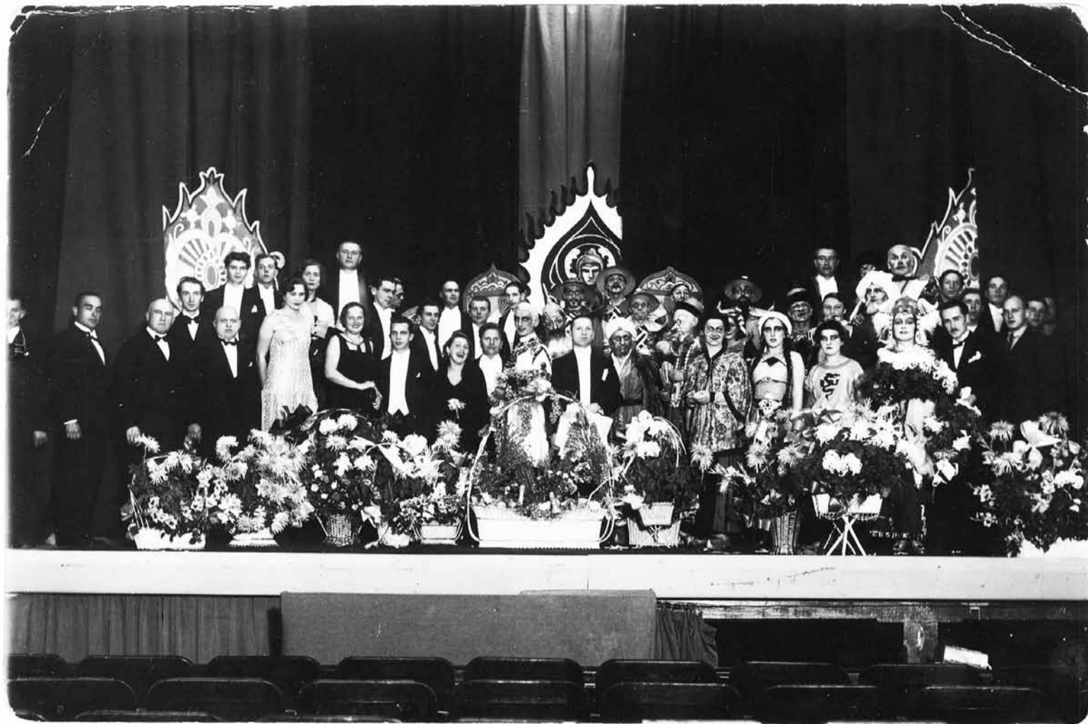
Šiaulių dramos teatro atidarymas 1931 m. rugsejo 23 d. Scenoje aktoriai, teatro vadovai, svečiai iš Valstybės teatro ir miesto atstovai