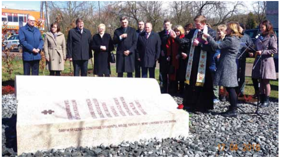
Paminklo Lietuvos savanoriams atidengimas. Penktas iš kairės – Ministras Pirmininkas Algirdas Butkevičius.

Balandžio 17 d. Raudondvaryje (Kauno r.) atidengtas paminklas Lietuvos savanoriams, Vyčio Kryžiaus kavaliereiams, kilusiems iš Raudondvario arba jame gyvenusiems. Šio paminklo kūrimą, kaip rašo Kovo 11-osios akto signataras dr. Leonas Milčius, finansavo vietos bendruomenės atstovai – keli raudondvariečių šeimos. Pakaunės krašto savanorių atminimas įamžintas netradicinės formos paminklu – suoliuko funkciją turinčia pusiau atversta istorijos knyga. Istorinių šaltinių duomenimis, į besikuriančią Lietuvos kariuomenę 1919 m. išėjo šimtai Garliavos, Babtų, Čekiškės, Raudondvario, Vandžiogalos, Lapių, Vilkijos, Zapyškio vyrų. Vilniui atsidūrus prieš rankose, Kaunas ir jo apylinkės tapo kovos už valstybės išlikimą centru.