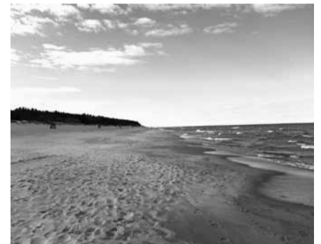
Baltijos pakrantė