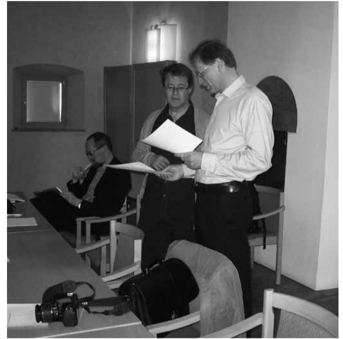
„Ecointense“ projekto rengėjų grupėje Norvegijos, Švedijos, Lietuvos, Lenkijos, Indijos, Tanzanijos, Dominikos ir Haičio atstovai