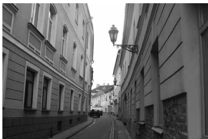
Vilniaus senamiestyje.

Su geriausiais linkėjimais „Mokslo Lietuvos“ redakcinė kolegija