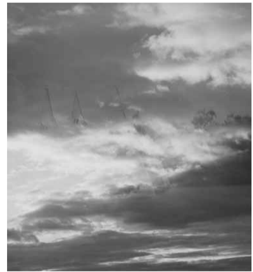
Fotomenininko Vytauto Babelio nuotraukos iš neseniai surengtos parodos „Sapnų pasaulis“