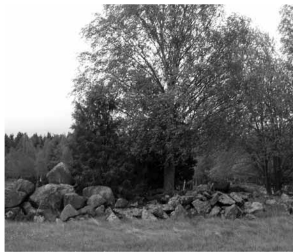
Švedijos ūkininko, gyvulių augintojo sklype visur kyšo didžiuliai akmenys, o medžių lapai dar tik skleidžiasi (fotografuota gegužės 22 d.)

sustabarėjusį, vos ne visu šimtmečiu (o kai kuriose valstybėse ir dar daugiau) atsilikusį požiūrį, kad vienintelė užmiesčio vietovių funkcija – žaliavos maisto produktams gamyba. Apie tai, kad būtina išsaugoti planetos biologinę įvairovę, pašalinti veiksnius, lemiančius labai pavojingus klimato pokyčius, užsimenama tik epizodiškai, tačiau ir tas rūpestis yra labiau parodomasis nei tikras. Apie