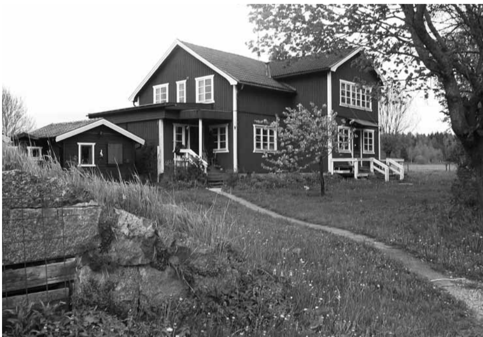
Ūkininko sodybos antrasis aukštas ir greta esantys nameliai paruošti priimti turistus

Dabar kuriamame „Ecointense“ projekte planuojami tiek milžiniško masto tarptautiniai tyrimai, tiek visiškai kita ugdymo koncepcija besiremiančių mokymo centrų ir gamybinių susivienijimų kūrimas. Laukus, kuriuose, nenaudojant jokių cheminių preparatų, nėra piktžolių, o dirvožemio struktūra kasmet gerėja, jų savininkai Švedijoje prižiūrėjo dešimtmetį ar dar ilgiau. Taip formuojasi visiškai kita ūkininkavimo, net mitybos samprata. Tuo tarpu Lietuvoje panašūs pavyzdžiai dar tebėra išimtis, o ne įprastinė praktika. Ne kartą teko susimąstyti, kodėl Skandinavijos šalyse, kur daug mažiau šviesos ir šilumos, kur iš žemės vos ne kiekviename žingsnyje kyšo milžiniški akmenys ar net uolų atbrailos, gaunami daug didesni javų derliai, geresni ir gyvulininkystės rezultatai. Laukia didžiulis darbas, kad tokia patirtis būtų pritaikyta visiškai kito klimato zonos, kad būtų formuojama gamtą tausojanti ūkininkavimo praktika, net pramonės strategija. Svarbiausia, kad būtų suvokta tai, jog jokia gyvenamoji vietovė negali būti kliūtimi asmenybės raiškai, kad socialinę ir kultūrinę atskirtį galima įveikti priemonėmis, visai nepanašiomis į tas, kurias dabar ir Lietuvoje naudojame. Vis girdime šūkius, kad būtina diversifikuoti užmiesčio vietovių ūkinę veiklą, bet nuo šūkių naujos įmonės neatsiranda. Vis skundžiamės, kad trūksta finansavimo, bet užmirštame atsakymą į klausimą: „Kodėl biednas?“