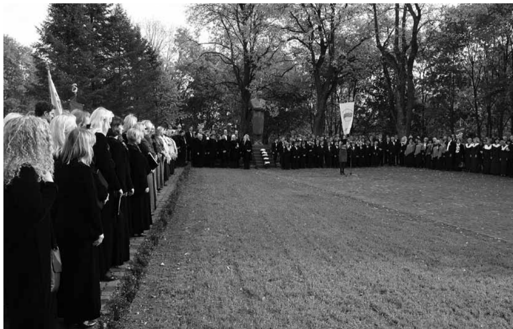
Mokslų daktaro laipsnio suteikimo ceremonijos eiseną Lundo universitete. Šios eisenos tradicija siekia 17-ojo šimtmečio pabaigą