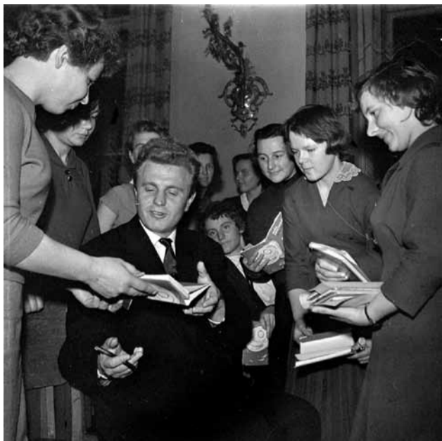
Archivinėje nuotraukoje: Poeto Justino Marcinkevičiaus autografa skaitytojams