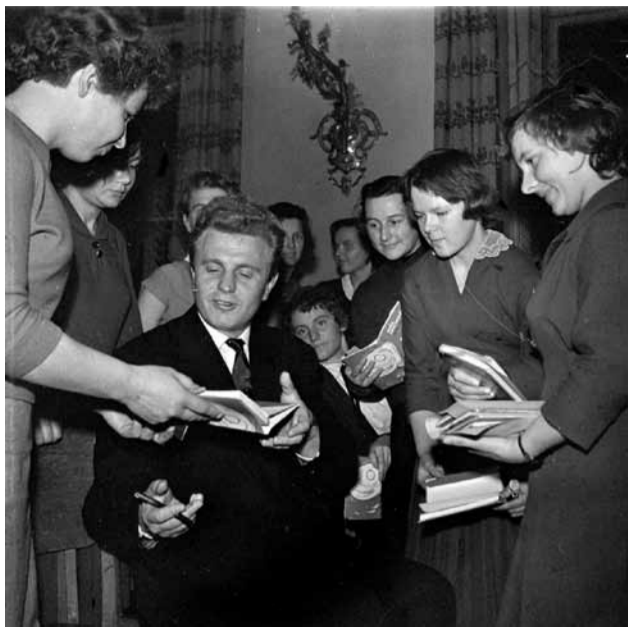
Archyvinėje nuotraukoje: Poeto Justino Marcinkevičiaus autografiškai skaitytojams