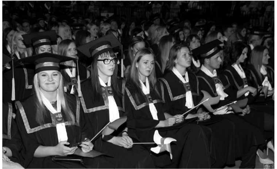
Lietuvos sveikatos mokslų universiteto absolventai.