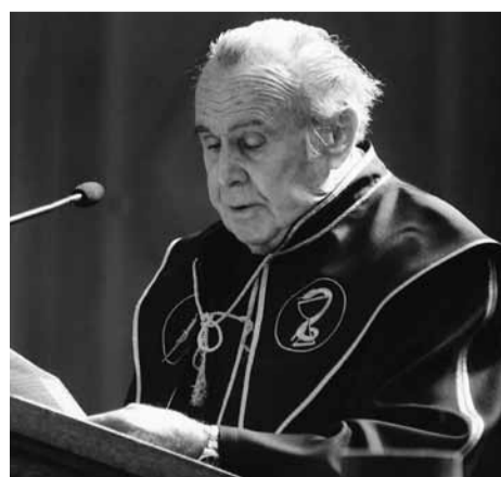
Nobelio premijos laureatas A. V. Schally