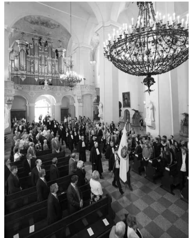
Šv. Jonų bažnyčioje tradiciškai pagerbti labiausiai universitetui nusipelnę akademinės bendruomenės nariai.