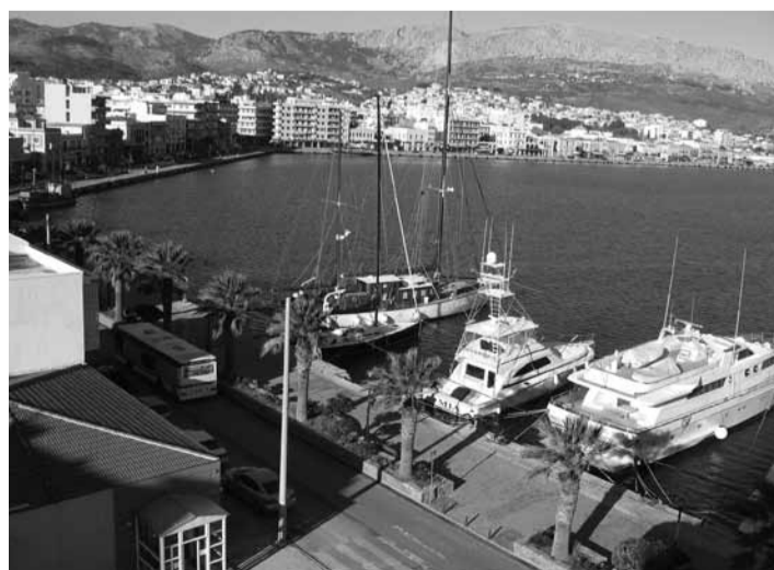
Chios mieste (to paties pavadinimo Graikijos saloje) saugomas Homero atminimas. Jame įsikūręs Egėjo (Agean) universiteto Verslo vadybos fakultetas