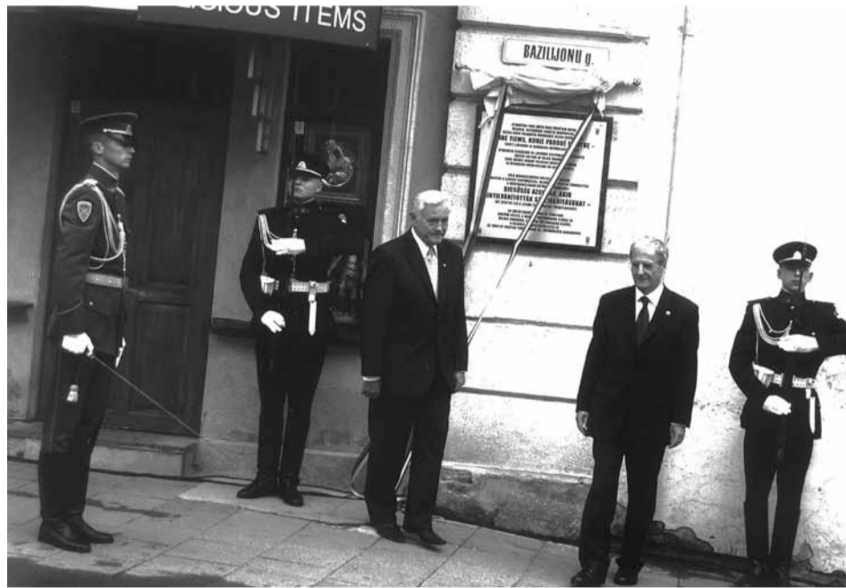
Lietuvos Respublikos Prezidentas Valdas Adamkus ir Vengrijos Respublikos Prezidentas Laszlo Solyom atidengia atminimo lentą Vengrijos revoliucionieriams

Vengrijos ambasadorius Kaune, Karmelitų kapinėse atidengė stelą su įrašais vengrų ir lietuvių kalbomis apie solidarumo mitin-