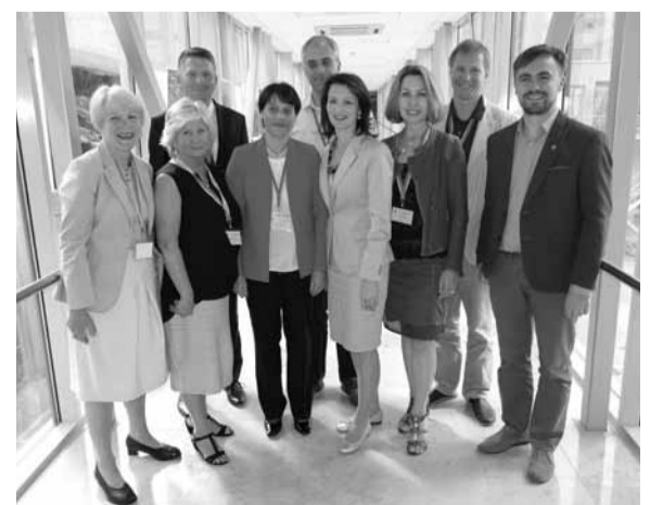
Naujoji PLB Valdyba 3 metų kadencijai