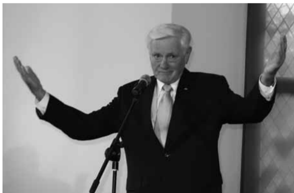
Pasaulio lietuvių bendruomenės Seimo dalyvius sveikina kadenciją baigęs Lietuvos Respublikos Prezidentas Valdas Adamkus

Liepos 15–17 dienomis Lietuvos Respublikos Seimo III rūmų Konferencijų salėje posėdžiavo XV Pasaulio lietuvių bendruomenės (PLB) Seimas. Jame dalyvavo PLB Valdybos nariai, kraštų lietuvių bendruomenių ir jaunimo sąjungų pirmininkai bei kraštų lietuvių bendruomenių atstovai. Apie 150 dalyvių iš 33 valstybių sprendė lietuvių bendruomenėms ir Lietuvos išeivijai aktualius klausimus. Dalyviai išklaušė pranešimai ir diskutavo apie Pasaulio lietuvių bendruomenės dabartį ir ateitį, lietuvių švietimą, bendradarbiavimą su Lietuvos Respublikos institucijomis. Pateikta Valdybos ataskaita apie PLB veiklą, išklausti Valdybos narių ir svečių pranešimai, numatytos svarbiausios veiklos kryptys ateinančioms trejiems metams. Šio PLB Seimo metu išrinkta nauja PLB Valdyba ir jos pirmininkas. Susitarta dėl organizacijos prioritetinių veiklos sričių per ateinančius trejus metus.