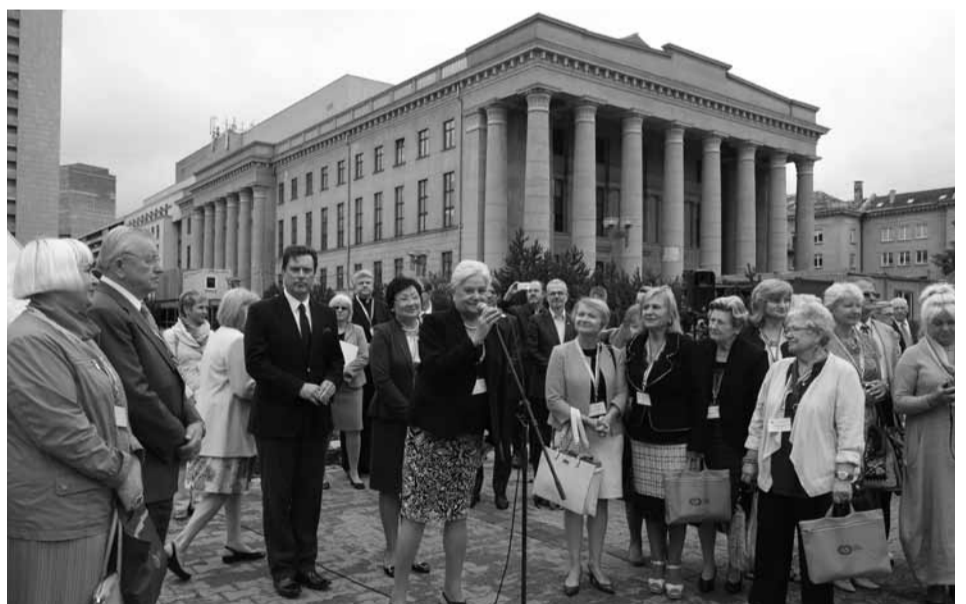
PLB Seimo nariai kartu su Lietuvos Respublikos Seimo nariais prie nacionalinės Martyno Mažvydo bibliotekos