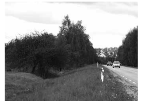
Pakelės obelis