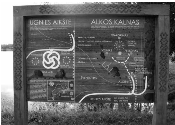
Lietuvos kultūros mažoji sostinė – Naisiai (Šiaulių r.)