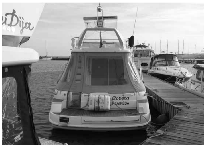
Jachtos Nidos prieplaukoje