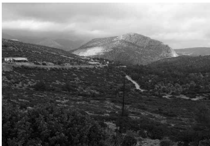
Vienas iš didžiausių Chios salos kalnų