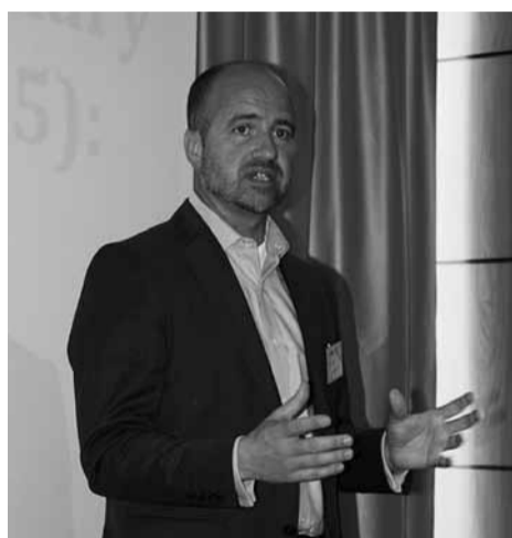
Pranešėjas - „Trestle group“ (Šveicarija) vykdamasis direktorius ir jos fondo tarybos narys Ralph Schonenbach