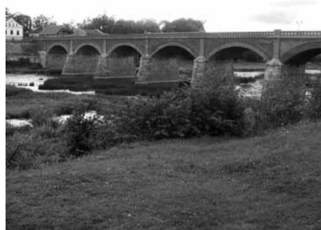
Arkinis tiltas per Ventą Kuldygoje