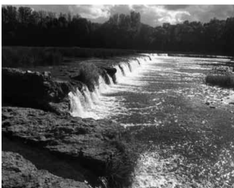
Ventos krioklys ties Kuldyga (Latvija) - plačiausias Europos Sąjungoje