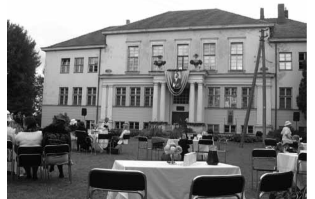
Lietuvos Respublikos Prezidento Antano Smetonos gimtadienio minėjimo iškilmės jo gimtinėje – Užulėnyje (Ukmergės r.)