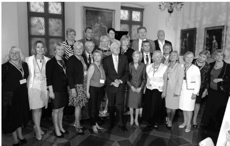
Pasaulio lietuvių bendruomenės Seimo išvakarėse. JAV delegacija PLB Seime su Prezidentu Valdu Adamkumi ir ponia Alma Valdovų rūmuose