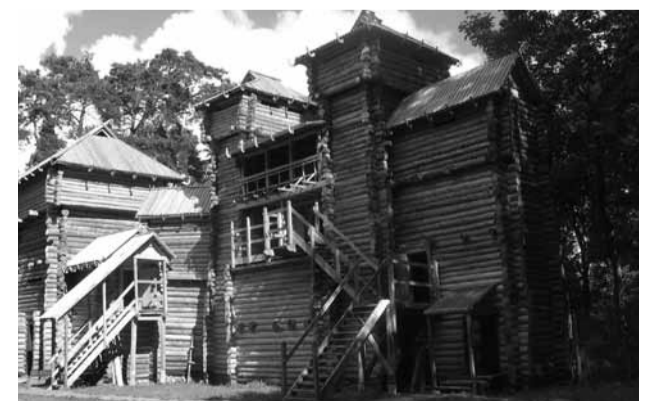
Atkurta viduramžių pilis Tervetėje (Latvija)