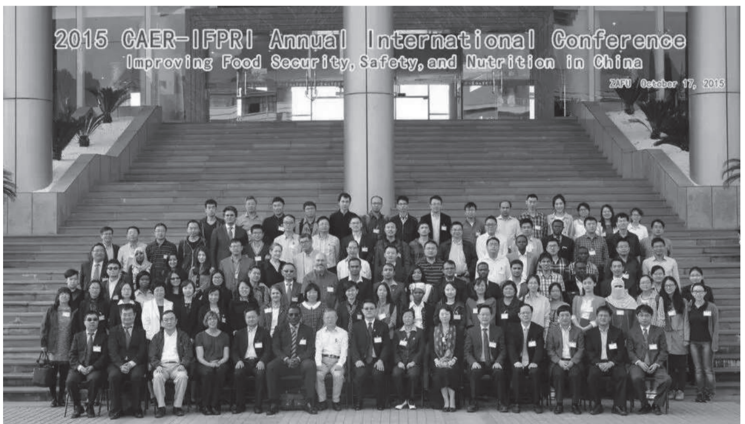
Tarptautinės mokslinės konferencijos dalyviai

apimtyms viršija eksportą. Tačiau ir šiuo metu apsirūpinimas soja, cukrumi ir pienu siekia mažiau nei 90 proc. šių produktų poreikio. Dėl didėjančių žemės ir darbo sąnaudų kyla pagrindinių žemės ūkio produktų gamybos kainos.