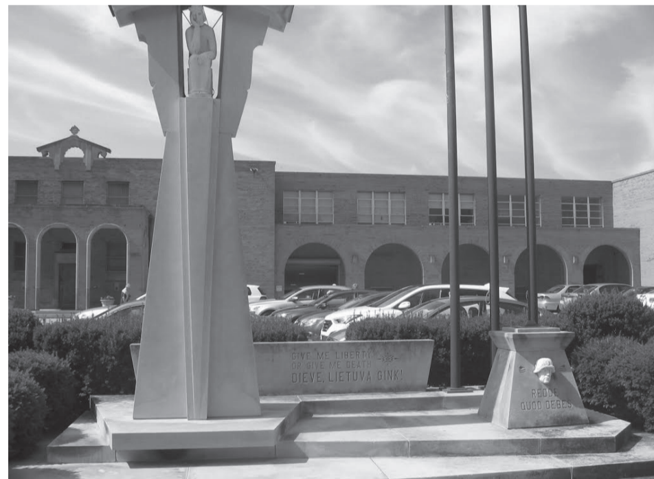
Paminklas Lietuvos nepriklausomybės kovoms įamžinti prie Klivlando lietuvių parapijos.

polka ir rokenrolas. Čia atsirado roko muzikos pavadinimas, susikūrė pirmos roko grupės, įrašų studijos, radijo stotis, įvyko pirmas roko muzikos koncertas. Rokenrolo meno šlovės muziejaus ( Rock and Roll Hall of Fame ) muzikiniame archyve yra ir gerai žinomos Šiaulių grupės „Vairas“ įrašų. Čia pa-