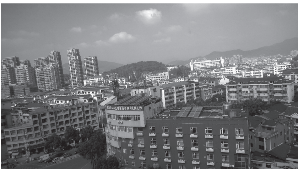
Kinijos Lin'an miesto panorama

Autorius yra Lietuvos agrarinės ekonomikos instituto vyresnysis mokslo darbuotojas