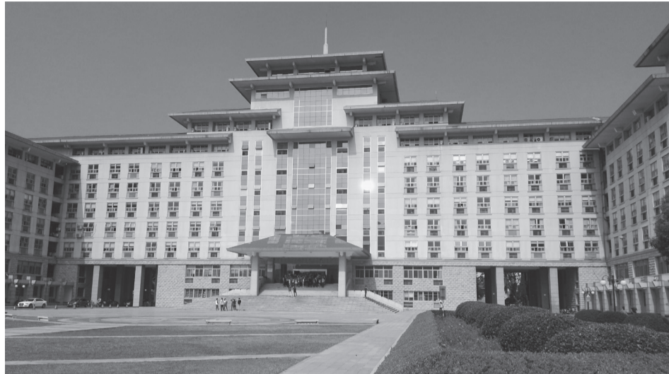
Nankino žemės ūkio universitetas

Nagrinėjant maisto saugumo klausimus, atkreiptas dėmesys, kad Kinijoje jau pagerėjo apsirūpinimas maistu: iki 2010 m. daugumai maisto produktų pastarasis rodiklis viršijo 97 proc. Nuo 2007 m. maisto produktų importo