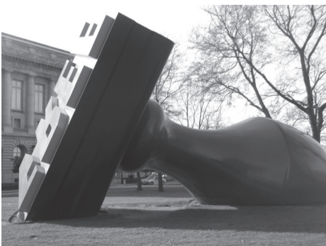
Didžiausias pasaulyje antspaudas – aikštėje šalia Klivlando miesto savivaldybės pastato

Vienas iš labiausiai sužavėjusių dalykų – aktyvi ir įvairiapusė amerikiečių savanorystė. Niekas, studijuodamas ir dalyvaudamas savanoriškoje veikloje, nesitiki atlygio, tačiau įgyja tokios patirties, kad po studijų baigimo gali laisvai integruotis į darbo rinką. Būdamas tarp paprastų žmonių, neišgirdau nė vieno nusiskundimo, kad kurios nors grupės užimtumas yra nedidelis, trūksta veiklos arba renginių. Ten vyrauja nuostata, kad žmogus, norintis ką nors nuveikti, visada ras veiklos sritį, naudingą visuomenei. Su tuo susijusi ir finansinė parama įvairių organizacijų