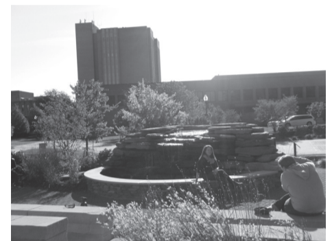
Kento universiteto studentų miestelis. Aukštasis pastatas – universiteto biblioteka. Autorės nuotr.

dėl kurčiųjų teisės bendrauti telefonais su artimiausiais pažeidimų įkalinimo įstaigoje. Į jo kalbą buvo labai greitai sureaguota – čia pat salėje iškart po pasisakymo tarybos administracijos atstovai jį pakvietė atskiram pokalbiui, kad į iškeltą problemą būtų greitai reaguota. Stebint tokią žaibišką reakciją į piliečio iškeltą problemą, susidarė įspūdis, kad JAV labai svarbios žmogaus teisės ir greitas atsakas į jų pažeidimus. Kitas nustebinęs dalykas buvo tai, kad dalyvaujant