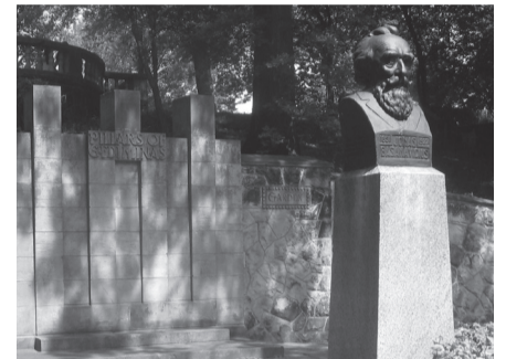
Jono Basanavičiaus biustas Klivlando lietuvių kultūros darželyje.

Parengta pagal LR Seimo 2015 m. lapkričio 9 d. pranešimą