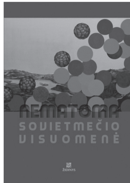
Knogos „Nematoma sovietmečio visuomenė“ viršelis