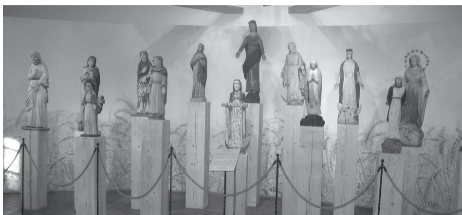
Žemaitijos sakralinis paveldas Kretingos muziejuje