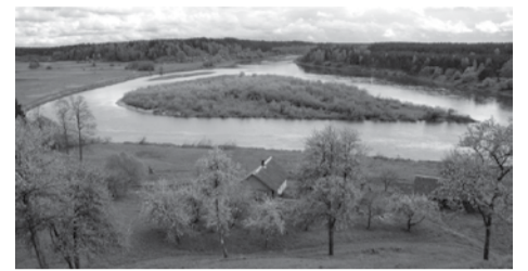
Nemuno ir Merkio santaka Dzūkijos nacionaliniame parke

temą. Daugelyje tarptautinių konferencijų akcentuojama, kad svarbu ne tik įsteigti saugomas teritorijas, bet ir užtikrinti vertybių apsaugą, pritaikyti jas lankymui. Per pastaruosius 10–15 metų ypač pasikeitė nacionalinių ir regioninių parkų veidas. Nauji lankytojų centrai su moderniomis ekspozicijomis kviečia leistis gamtos takais. Apžvalgos bokštai atveria didingas kraštovaizdžio panoramas. Pažintiniai takai kviečia atrasti unikalius gamtos kampelius ir jų grožį. Smagu kopti į sutvarkytus ir pritaikytus lankyti piliakalnius, regyklas.