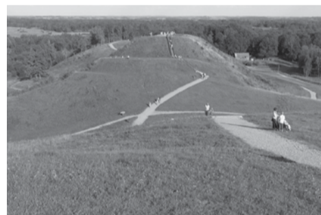
Medvėgalio piliakalnis Varnių regioniniame parke

Stiprinti moterų apsaugą nuo smurto. Lietuvos valstiečių ir žaliųjų sąjungos frakcijos nariai inicijavo bendrą, visoms Seimo frakcijoms atstovaujančių Seimo narių deklaraciją dėl moterų apsaugos nuo smurto. Seimo nariai ragina Lietuvos Respublikos Vyriausybę nebetęsti prieštarai vertinamos Stambulo konvencijos ratifikavimo procedūros, o daugiau dėmesio skirti Lie-