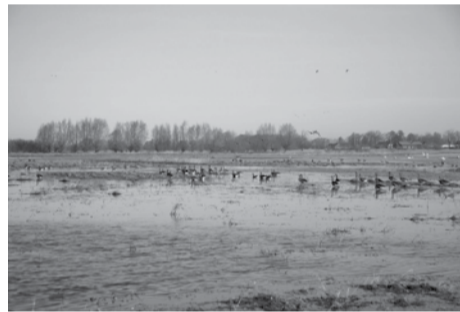
Nemuno deltos regioninis parkas

Bene pagrindinė kiekvienos šalies priemonė kraštovaizdžiui, gamtai, vertybėms išsaugoti – saugomos teritorijos. Bet dar svarbiau – sukurti saugomų teritorijų sis-