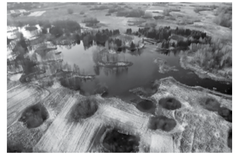
Karstinės įgriuvos Biržų regioniniame parke

temą. Daugelyje tarptautinių konferencijų akcentuojama, kad svarbu ne tik įsteigti saugomas teritorijas, bet ir užtikrinti vertybių apsaugą, pritaikyti jas lankymui. Per pastaruosius 10–15 metų ypač pasikeitė nacionalinių ir regioninių parkų veidas. Nauji lankytojų centrai su moderniomis ekspozicijomis kviečia leistis gamtos takais. Apžvalgos bokštai atveria didingas kraštovaizdžio panoramas. Pažintiniai takai kviečia atrasti unikalius gamtos kampelius ir jų grožį. Smagu kopti į sutvarkytus ir pritaikytus lankyti piliakalnius, regyklas.