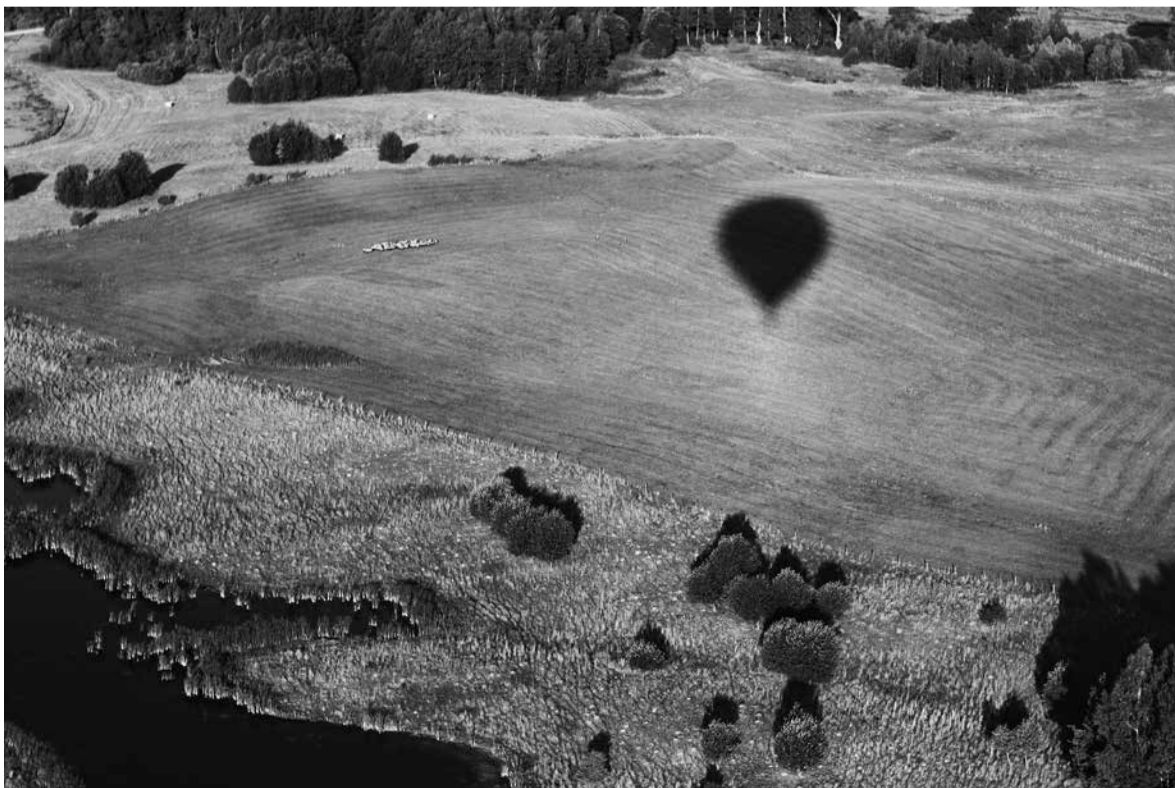
Lietuva iš oro baliono.