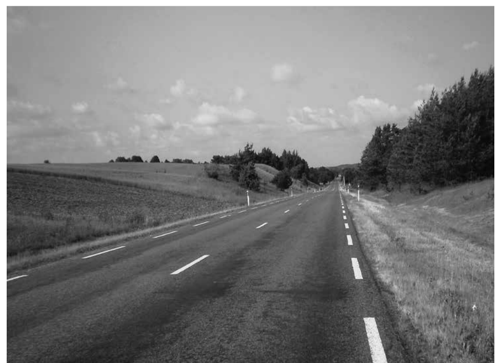
Lietuva. Plantas.