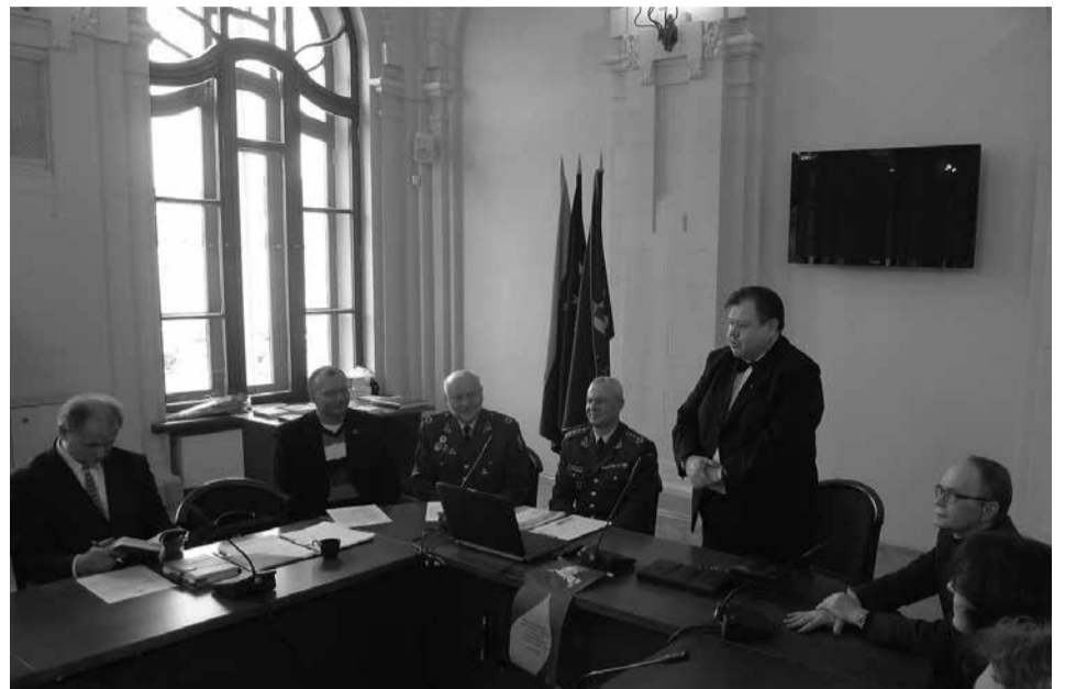
Nuotraukos iš renginio