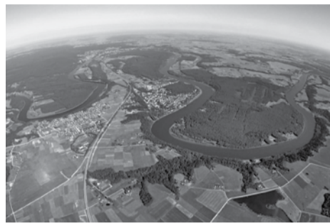
Didžiosios Nemuno kilpos

tuvos teisės aktų tobulinimui, gerinant moterų apsaugos nuo smurto sistemą. Lietuvos teisinėje sistemoje galioja visos pagrindinės kovai su smurtu prieš moteris skirtos teisinės nuostatos, kurias siekia įdiegti Stambulo konvencija, ir šios teisės nuostatos gali būti tobulinamos neratifikuojuant Stambulo konvencijos.