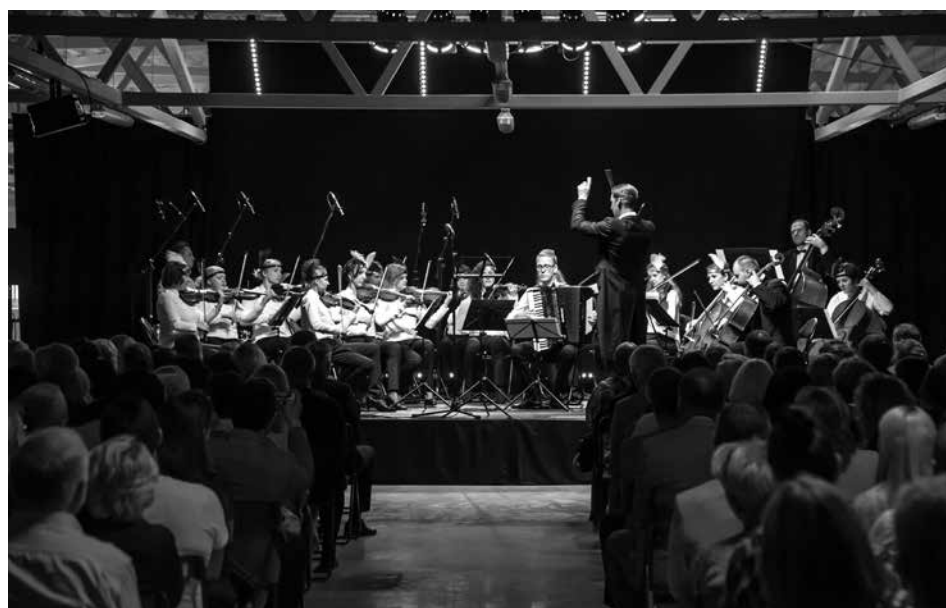
VDU Kultūros dienų renginyje.