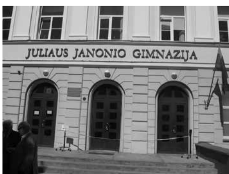
Šiaulių Juliaus Janonio gimnazija