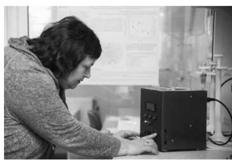
Darbas su elektromagnetinio lauko įranga

Tiek šaltoji plazma, tiek elektromagnetinis