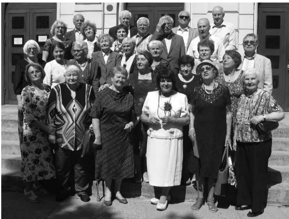
107-osios laidos (1958) abiturientai

Šiomis dienomis visose Lietuvos gimnazijose paskutines dienas su bendraklasiais leidžia šių metų laidos abiturientai. Dalis jų rudenį taps universitetų ir kolegijų studentais, o kita dalis pasirinks kvalifikuoto darbininko kelią arba dalyvaus šeimos versle. O kuri dalis, vos pasibaigus egzaminams, paliks Lietuvą ir pasirinks emigranto dalią? Apklauso grėsmingai liudija, kad tokių kai kuriose mokyklose gali būti daugiau nei trečdalis. Tarp pastarųjų yra tokių, kurių šeimos nariai jau ne vienerius metus darbuojasi Vokietijoje, Anglijoje, Airijoje, Norvegijoje ir kt. Neseniai Pasaulio lietuvių bendruomenės inicijuotas tyrimas parodė, kad naujausios bangos išeiviai iš Lietuvos gyvena daugiau kaip 40 valstybių.