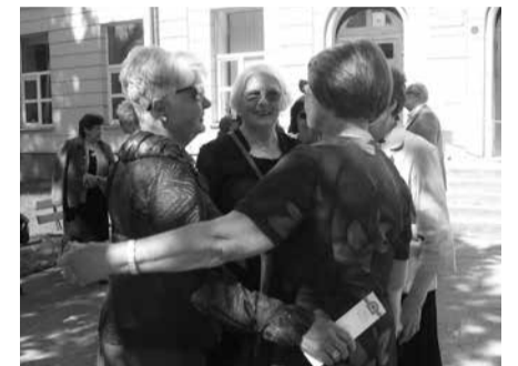
Apsikabinimas po 60 metų nuo mokyklos baigimo