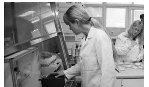
Darbas su moderniausia šaltos plazmos įranga

VDU Gamtos mokslų fakulteto laboratorijoje vykdomi itin intensyvūs tyrimai,