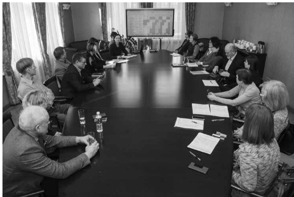
VDU, KTU, LEI ir LSMU darbuotojai.

Fondo steigėjai ketinimus bendrai finansuoti projektus įtvirtino sutartimi. Konkurse dalyvavę projektai buvo vertinami pagal šešis vertinimo kriterijus, tarp kurių vienas svarbiausių – jų praktinis pritaikymas, galimybė patentuoti ir komercializuoti projekto rezultatus. Taip pat buvo įvertinta galimybė teikti paraišką išoriniam finansavimui gauti,