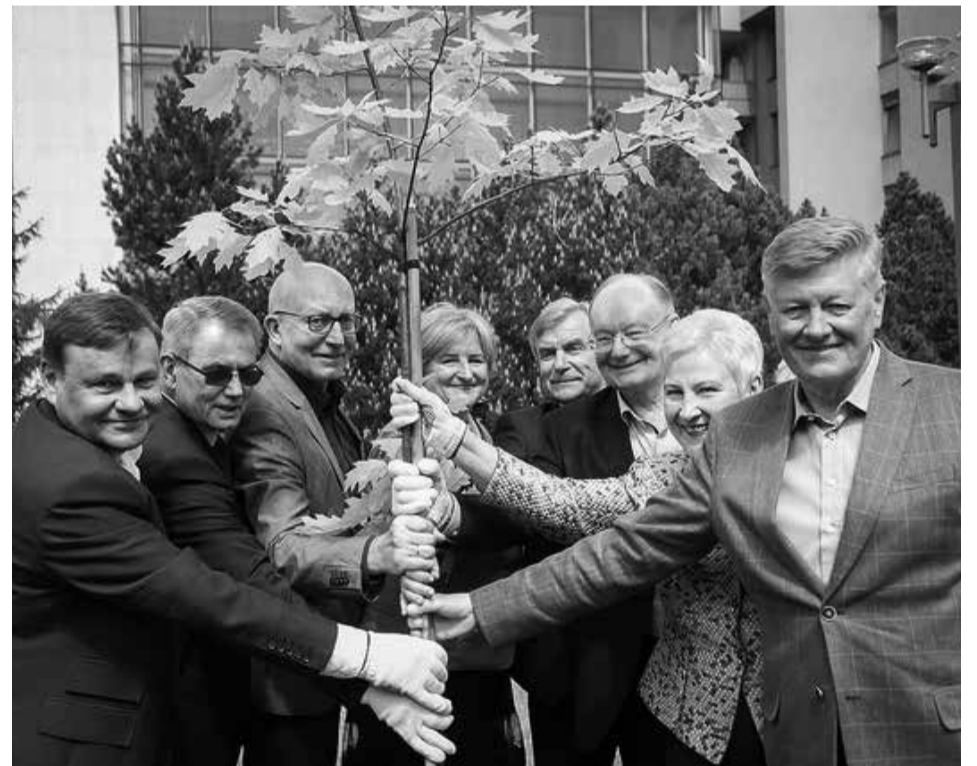
Lietuvos šimtmečio ažuolas.

Lietuvos šimtmečio ažuolas. Seimo Pirmininkas Viktoras Pranckietis kartu su praėjusių kadencijų Seimo pirmininkais prie Seimo pasodino ažuoliuką, skirtą paminėti atkurtos Lietuvos šimtmetį. „Iki šiol Seimo pirmininkai neturėjo tradicijos susitikti. Viliuosi, kad nuo šiandien tai galės vykti dažniau. Šįkart kartu pasodinome simbolinį Lietuvos šimtmečio ažuolą prie Seimo rūmų. Paaugęs jis matysis ir pro plenarinių Seimo posėdžių salės langus. Tikiuosi, kad jis bus vienybės bei bendro tikslo simbolis ir šiuose rūmuose dirbantiems, ir pro juos