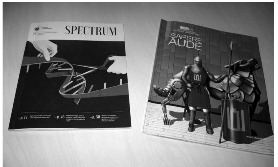
Universitetų periodiniai leidiniai.

Kaip ir dera technikos universitetui, VGTU pavasarinio leidinio (Nr. 3) viršelį puošia Tomo Mitkaus paveikslas, vaizduojantis Vilniaus įkūrėją su už jo stovinčiu Geležiniu Vilku.