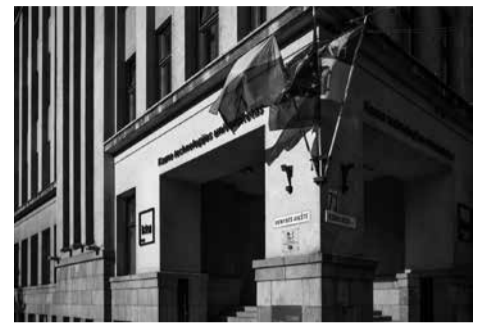
KTU centriniai rūmai

– Tokių tikrai yra. Tikimės, kad jie dalyvaus konkurse. Šiuo metu dirbame su