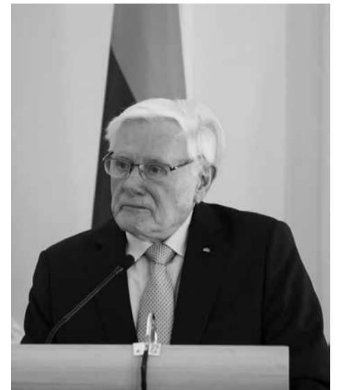
VDU tarybos pirmininkas Prezidentas Valdas Adamkus.