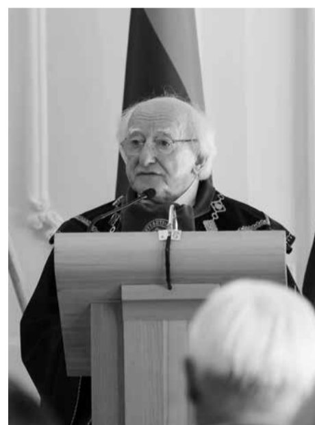
Kalba VDU Garbės daktaras M. D. Higgins

Garbės daktaro vardas prezidentui suteiktas socialinių mokslų srityje už humanistinių vertybių sklaidą, veiklą žmogaus teisių srityje ir savo šalies paveldo išsaugojimą. Anot VDU rektoriaus profesoriaus