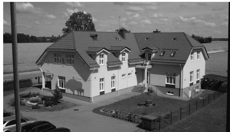
Atnaujinti lankytojų centrai

noras pažinti savo kraštą, žinoti jo istoriją ir papročius yra sveikintinas, todėl privalu sudaryti tam patogiausias sąlygas, o ne dirbti taip, kaip patogiau ar pigiau. Autorius yra Lietuvos Respublikos Seimo narys