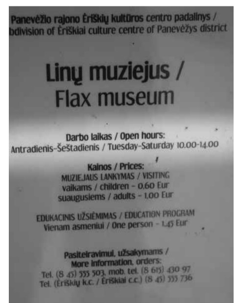
Linų muziejaus darbo laikas

Nė vienas populiarus sostinės muziejus nedirba sekmadieniais. Energetikos ir technikos muziejus, Lietuvos pinigų muziejus, Saugomų teritorijų nacionalinis lankytojų centras ir Bažnytinio paveldo muziejus lankytojų laukia darbo dienomis bei šeštadieniais iki maždaug 18 val. Analogiška situacija ir Kaune – dažniausiai lankomi Vaikų literatūros ir Lietuvos aviacijos muziejai lankytojus priima darbo dienomis ir šeštadienį iki ankstauro vakaro. O norint aplankyti Atominio bunkerio muziejų, dar reikia ir išankstinio susitarimo. Pajūrio krašte situacija ta pati – nei Pilies, Kalvystės, Mažosios Lietuvos istorijos muziejai, nei Skulptūros parkas nepriima lankytojų sekmadieniais. Analogišką situaciją galima pamatyti ir Šiaulių, Panevėžio bei Anykščių apskrityse – dažniausiai lankomi ir populiariausi muziejai priima gyventojams nepatogiu darbo laiku. Pavyzdžiui, Linų muziejus Panevėžio rajone vasarą šeštadieniais dirbo tik iki 14 val.