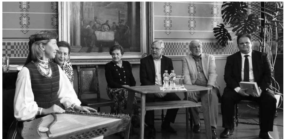
Knygos sutiktuvė pradžia