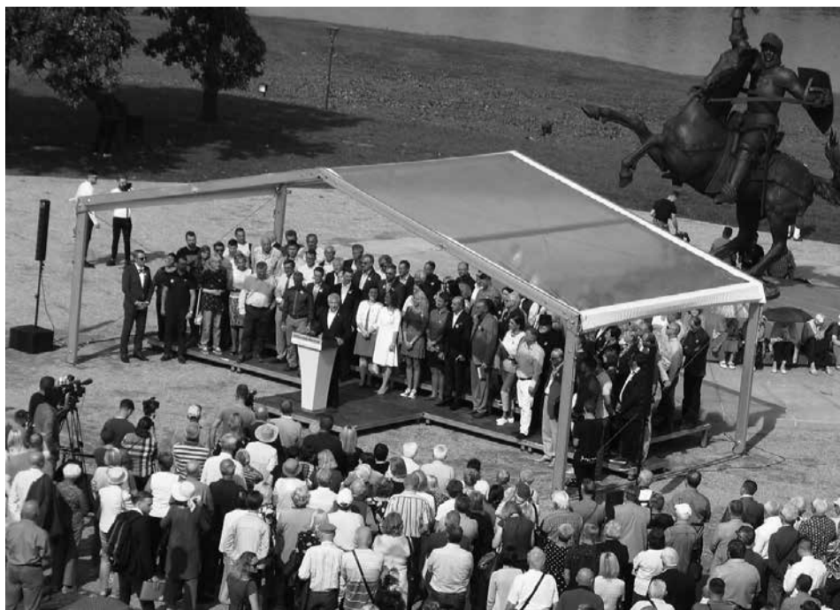
Vygaudas Ušackas (tribūnoje) kreipiasi į susirinkusius.

Rugsėjo 5 d. Kauno technologijos universiteto Europos instituto vadovas ambasadorius Vygaudas Ušackas Kaune prie Vyties – „Laisvės kario“ pamin-