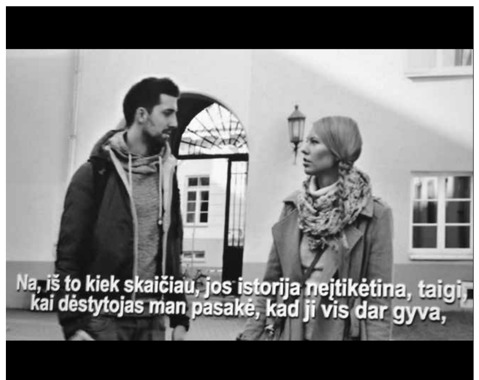
Kadras iš filmo: „Dėstytojas man pasakė, kad ji vis dar gyva...“

Sovietmečiu Romos katalikų bažnyčia Lietuvoje buvo vienintelė nepriklausoma institucija, ne tik ginanti tikinčiųjų teises, bet ir kovojanti už laisvą Lietuvą, laisvą žodį ir spaudą. Ačiū šio renginio iniciatoriams, organizatoriams už puikų šio filmo pristatymą. Linkėčiau, kad panašūs pristatymai įvyktų jaunimo visuomeninių organizacijų erdvėse ir visose Lietuvos mokyklose. Autorius yra Lietuvos sąjūdžio Kauno tarybos pirmininkas ■