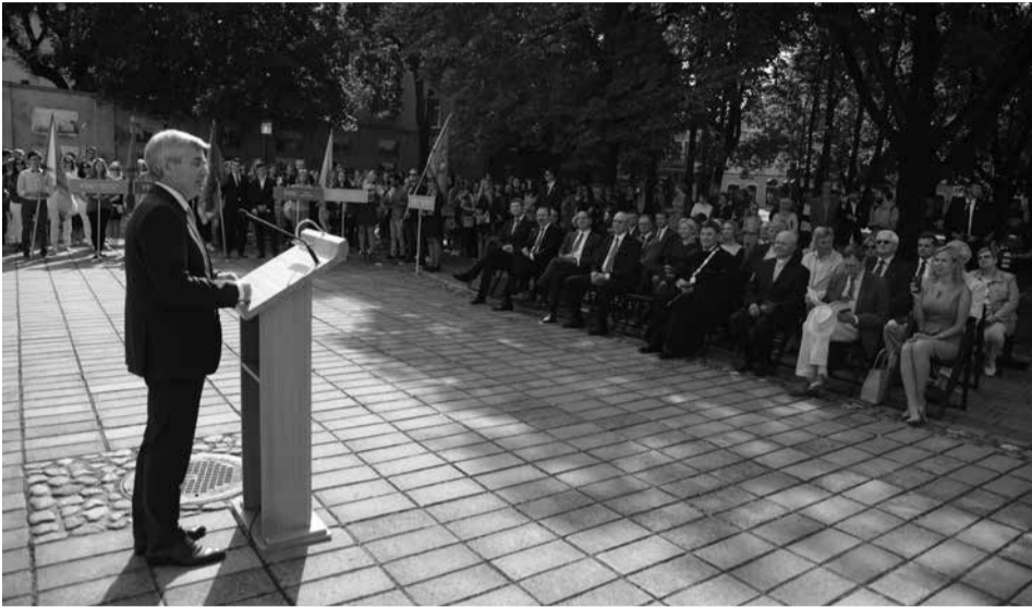
Sveikina LR Seimo pirmininkas prof. dr. Viktoras Pranckietis