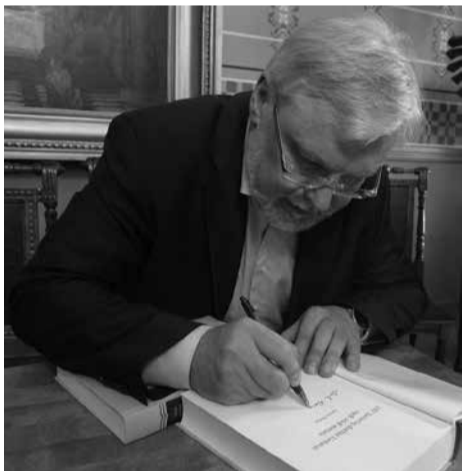
Autorius įrašo autografą skaitytojui