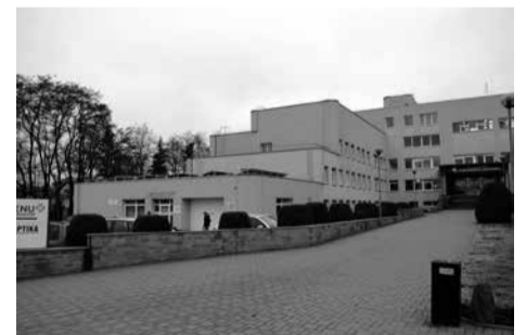
Alytaus apskrities Stasio Kudirkos ligoninė