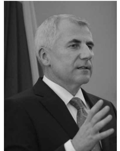
KTU Europos instituto vadovas ambasadorius Vygaudas Ušackas, jau paskelbęs apie kandidatavimą Lietuvos Prezidento rinkimuose

Akademei bendruomenei ypač artimos besimokančio jaunimo visapusiško ugdymo problemos. Mums tikrai ne tas pats, kokie auklėtiniai pasibels į universitetų ir kolegijų auditorijas. Tačiau jau daugiau kaip dešimtmetis, kai tiek edukologijos tyrimai, tiek dialogas su pedagogais praktikai pateko į viešosios erdvės užribį. Keista, kad ir dabartinė Švietimo ir mokslo ministerijos vadovybė neįaučia pedagoginės žiniasklaidos poreikio. Šios ministerijos leidžiamos „Švietimo naujienos“ tikrai negali užpildyti atsiradusios spragos. Tokia padėtis nesiderina su demokratinės valstybės statusu. ■