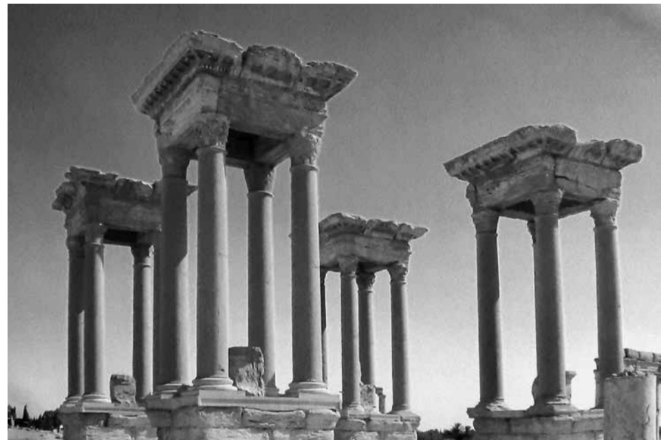
Palmyros miesto griuvėsiai.