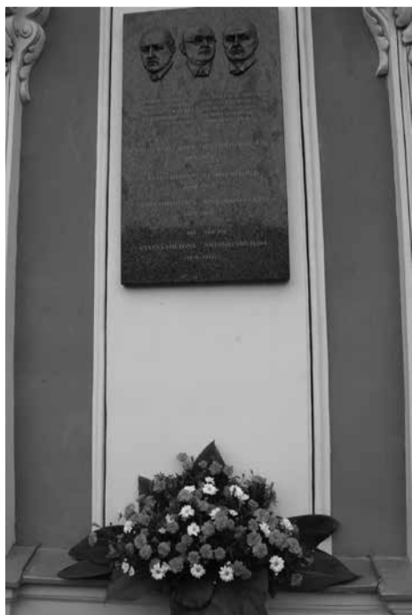
Signatarų atminimo lenta