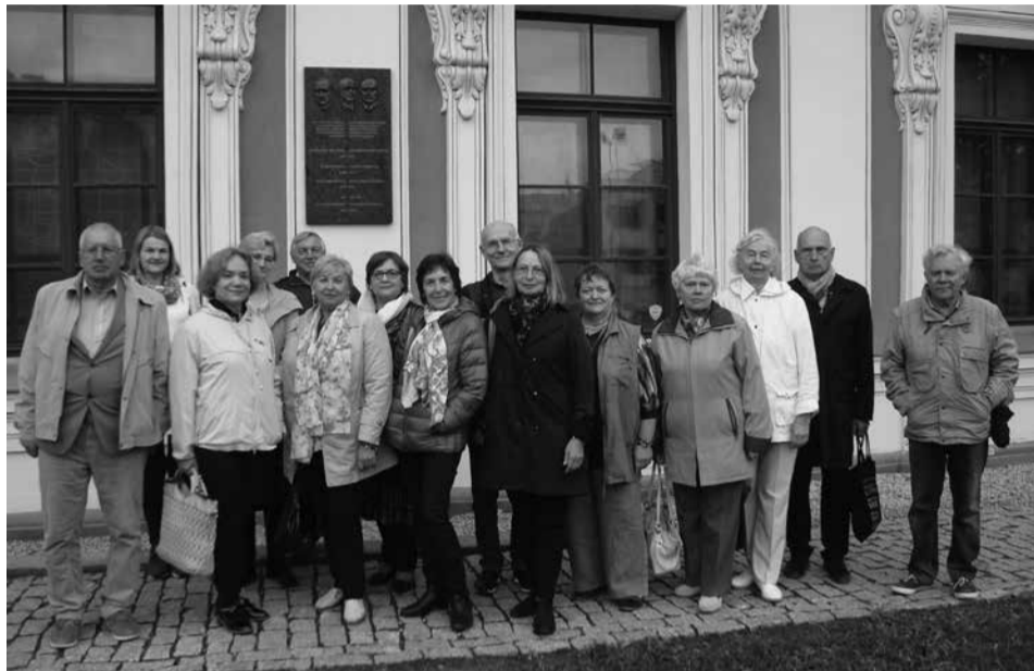
Baltų centro ir Šiaulių UNESCO klubo nariai prie atminimo lentos Vasario 16-osios Nepriklausomybės akto signatarams