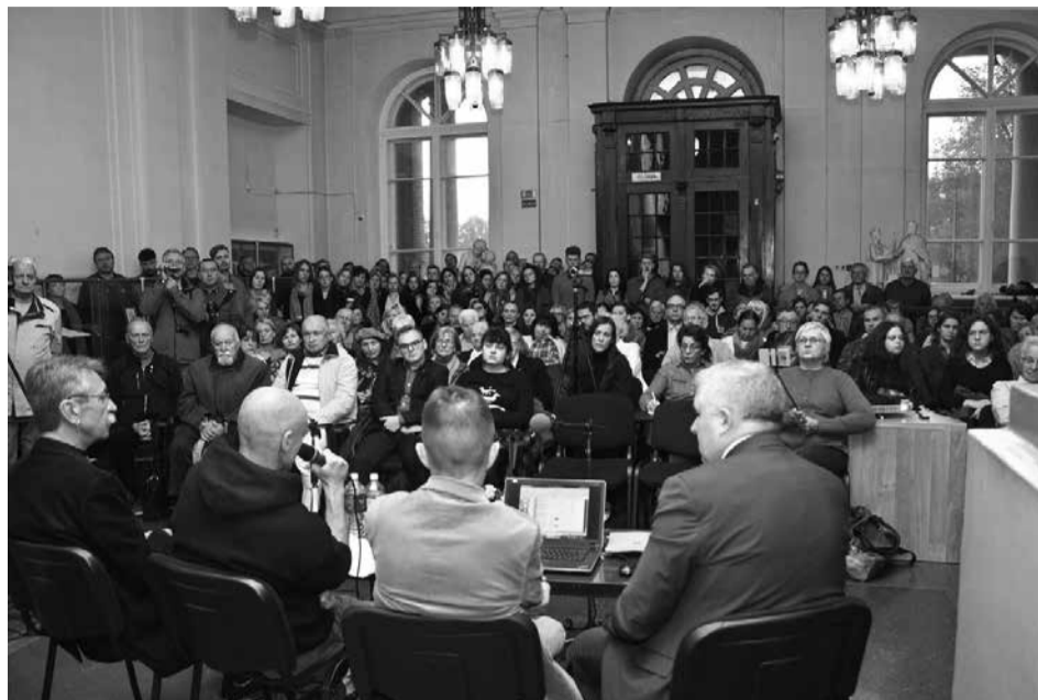
Adolfo Ramanausko-Vanago istorijos tyrimų pristatymas pilnutėlėje LMA Vrublevskių bibliotekos salėje