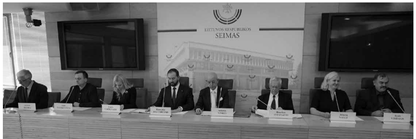
LRS ir PLB komisijos baigiamasis posėdis (2018 m. spalio 12 d.).

8) Lietuvos kultūros pristatymas ir sklaida užsienyje.