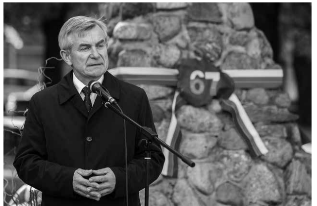
Seimo Pirmininkas Viktoras Pranckietis 1951 m. trėmimų paminėjime.

Visuomenei pristatyta Užimtumo tarnybos pertvarka. 2017 m. pabaigoje Seimui ir Vyriausybei pritarus, Socialinės apsaugos ir darbo ministerija bei Lietuvos darbo birža šiemet įgyvendino vieną didžiausių institucinių pertvarkų