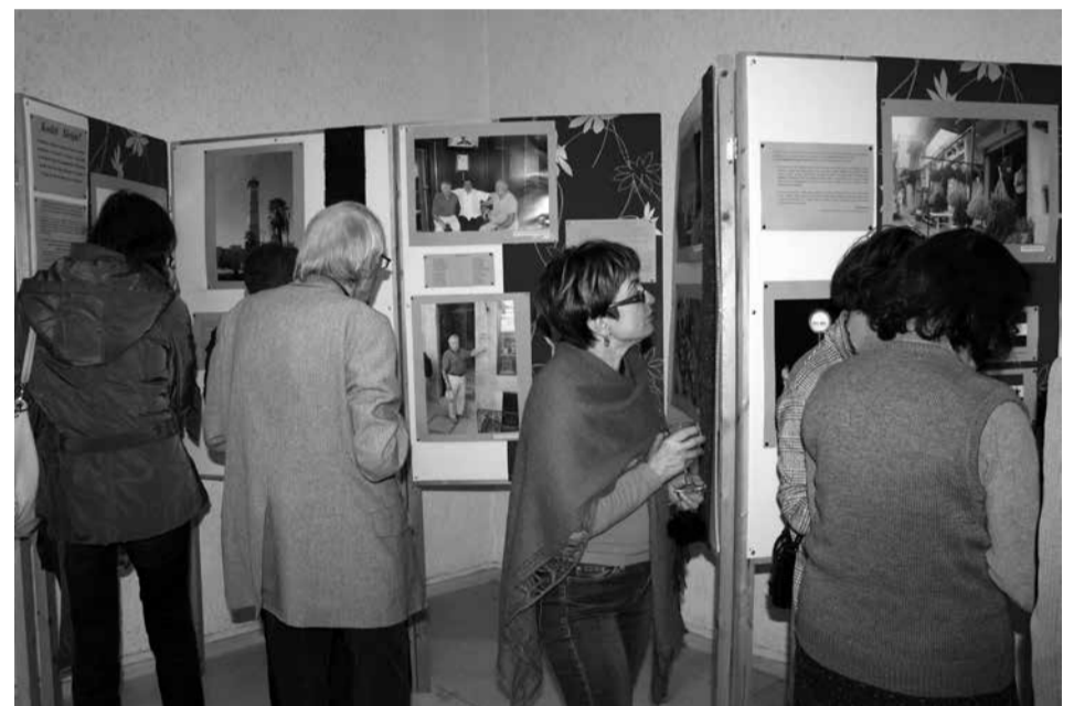
Pirmieji parodos lankytojai.