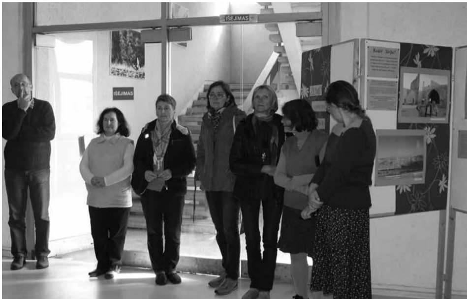
Parodos atidarymo akimirka.