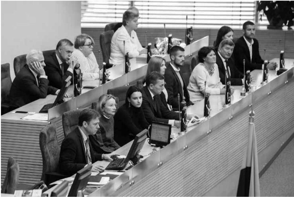
Minėjimo svečiai.