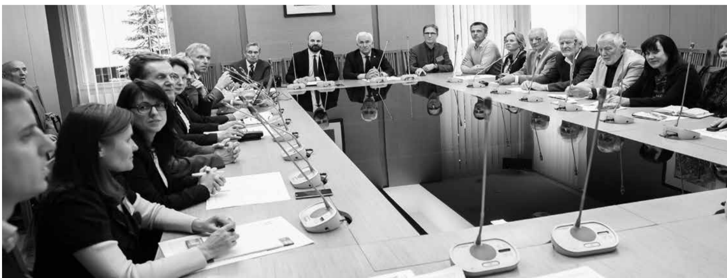
Laikinosios Seimo ir akademinės bendruomenės bendradarbiavimo grupės posėdžio dalyviai Lietuvos tarybos salėje Seime (spalio 5 d.).

Dėl dokumentų teikimo elektroninėje sistemoje kreipkitės į sistemos administratorę E. Gričiūtę (tel. (8 692) 45 332, el. p. e.griciute@lma.lt ). ■