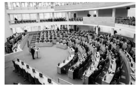
Dr. B. Lubio 80-ųjų gimimo metinių minėjimas Seime

Dr. B. Lubys staiga mirė 2011 m. spalio 23 d. nuo širdies priepuolio Druskininkuose. Palaidotas gimtojoje Plungėje. ■