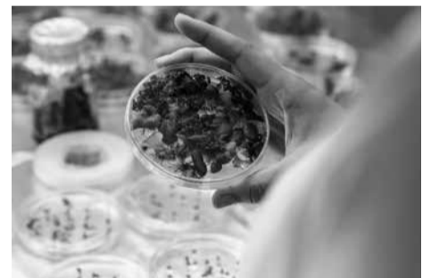
Atviros prieigos laboratorijoje

džių. Tiesa, šiuolaikiški inovatyvūs tyrimų metodai yra gana brangūs, tačiau, ieškodami atsakymų į kilusius klausimus, verslininkai finansuoja jiems aktualius mokslinius tyrimus. ■