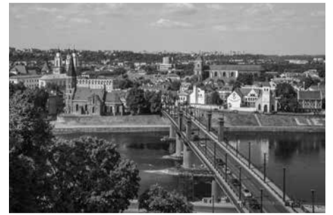
Kauno vaizdas.

Susitikime dalyvavo beveik 40 Kauno technologijos universiteto, Lietuvos sveikatos mokslų universiteto, Lietuvos sporto