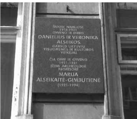
Atminimo lenta ant namo Vilniuje, Jogailos g. 11.