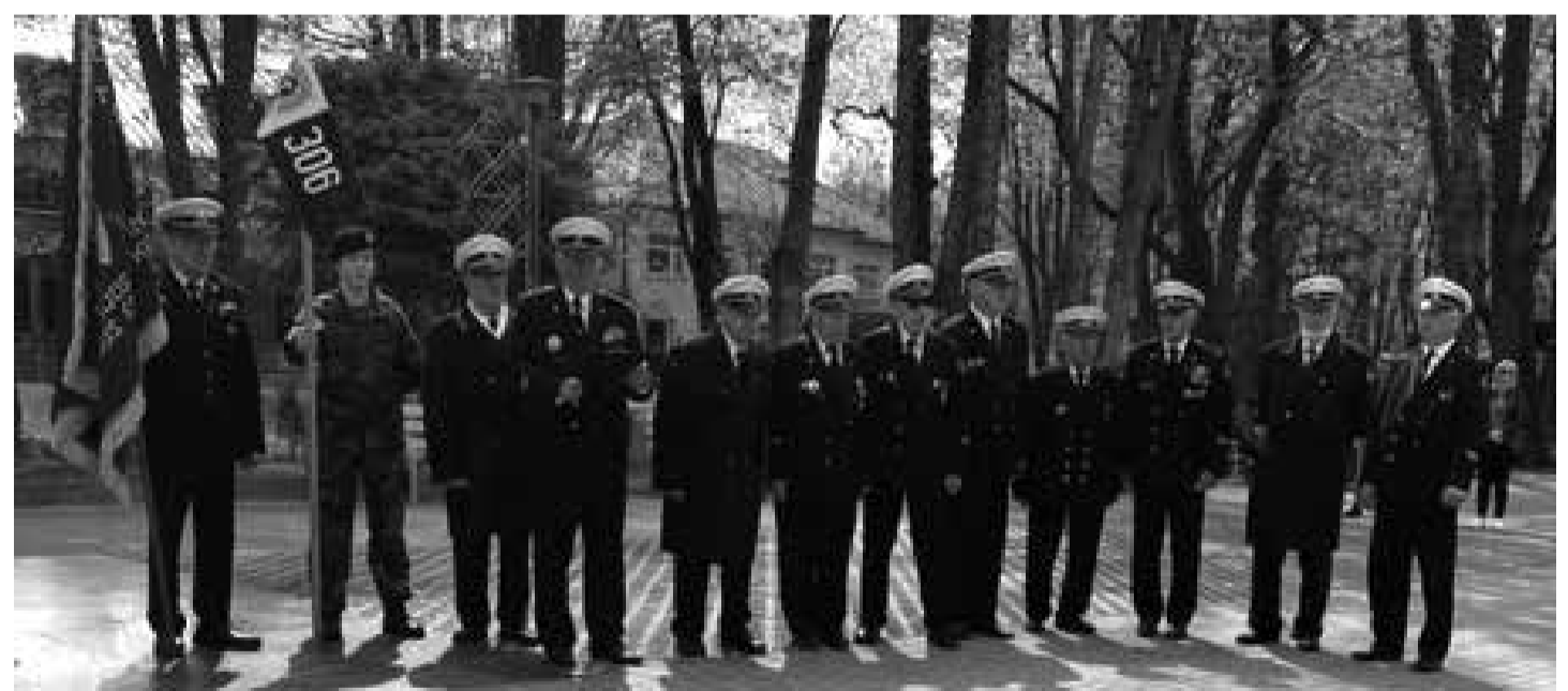
Šaulių rikiuotė Palangoje.

istoriją pasaulyje ir Lietuvoje. Įgimtų širdies ydų chirurgija – viena iš sudėtingiausių medicinos specialybių. Labai didelė šių ydų įvairovė. Daugelio ydų ištaisymui reikia labai sudėtingų operacijų, o visam šių ligoninių