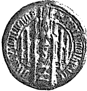
Pieczęć Macieja biskupa wileńskiego z r. 1432.

Wyd. Kutrzeba St. i Semkowicz Wł., Akty unji Polski z Litwą (Kraków 1930) str. 77 nr 55.