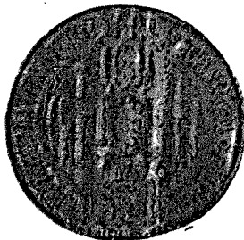
Pieczęć Mikołaja biskupa wileńskiego z r. 1455.

Or. pap. w Archiwum Państwowem w Krdlewcu, Ordensbriefarchiv 68 nr 3. Wśród sześciu pieczęci, wyciśniętych przez papier, na pierwszym miejscu pieczęć Mikołaja biskupa wileńskiego, okrągła, średn. 40 mm., wyobraża pod gotyckiem podniebieniem tarczę z herbem Wieniawa; nad tarczą popiersie biskupie; w otoku napis: + s × nicolai × dei × gra || episcopi wilnensf.