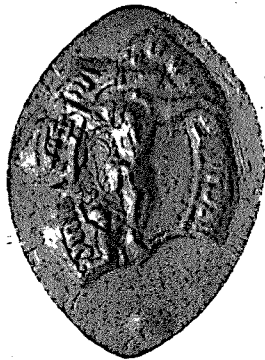
Pieczczę wikarjusza kontraty litewskiej zakonu franciszkanów w Wilnie z r. 1398.

et ordinatum, et si quod vel que testamenta fieri possunt in posterum volumus firmissime et inviolabiliter observare. Et si aliquid de iure vel de facto cum aliquo ex nostris canonicis a nos agere contingerit, coram vobis et nostro capitulo illud discernere volumus et non coram alio amicabiliter componendo. Et si, quod absit, aliquem ex principibus vel nobiles se contra ecclesiam nostram predictam vel contra aliquam personam ecclesiasticam manu seculari arguere contingerit, contra illum pro ecclesia et persona eiusdem ecclesie se fideliter opponere volumus incessanter. Premissis idcirco omnibus et 5 ipsis non obstantibus vobis totique capitulo presentibus offerimus, ut possitis et valeatis omnes iniuriatores, occupatores violentos decimarum vestrarum et aliarum rerum quarumlibet raptores ac hominum vestrorum et ecclesie molestatores in dyocesi nostra existentes 1 sentenciis excommunicationum 10 premissa canonica monicione et aggravacionum innodare et ipsos ab eisdem sentenciis, habita satisfaccione de premissis, absolvere de premissis auctoritatem nostram damus et committimus plenam et omnimodam potestatem. In cuius rei testimonium nostrum sigillum presentibus est appensum. Datum et actum Wylne, ipso die beate Barbare virginis et martyris gloriose anno Domini millesimo CCC o nonagesimo octavo b . 15