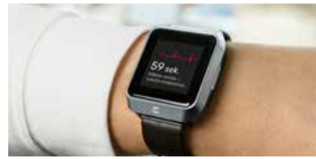
Išmanioji medicininės paskirties apyranke „TeltoHeart“

„Prietaisų realiomis sąlygomis registruojamų fiziologinių signalų kokybė yra kur kas prastesnė nei klinikoje registruojamų biosignalų. Todėl vienas iš pagrindinių iššūkių,