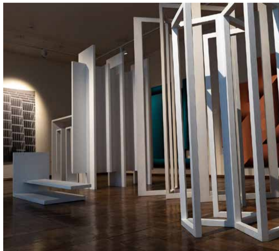
Paroda Kazio Varnelio namuose – muziejuje. Miestovaizdžiai.