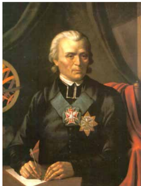
Martynas Počobutas, VU rektorius (1780–1799)

Abu asteroidai rasti Vilniaus universiteto