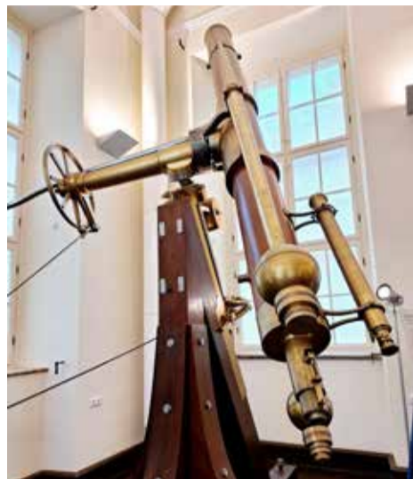
Jozefo Fraunhoferio teleskopas refraktorius, pasiekęs Tartu 2024 m.