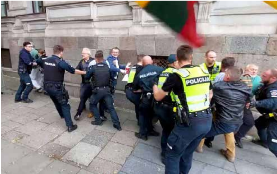
Protestuotojai bandė apginti pirmojo savanorio Kazio Škirpos atminimo lentą