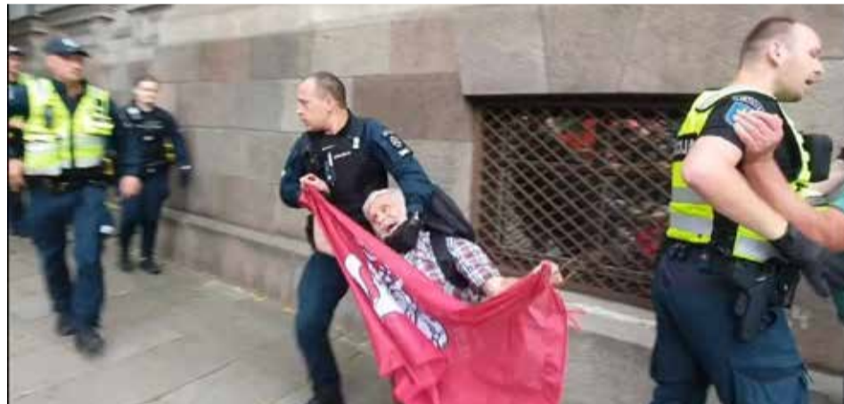
Policijos pareigūnai tempia protestuotoją, laikantį Lietuvos vėliavą

N eabejojame, kad vidaus reikalų ministrė pasitiki policijos pareigūnų profesionalumu smurtaujant prieš