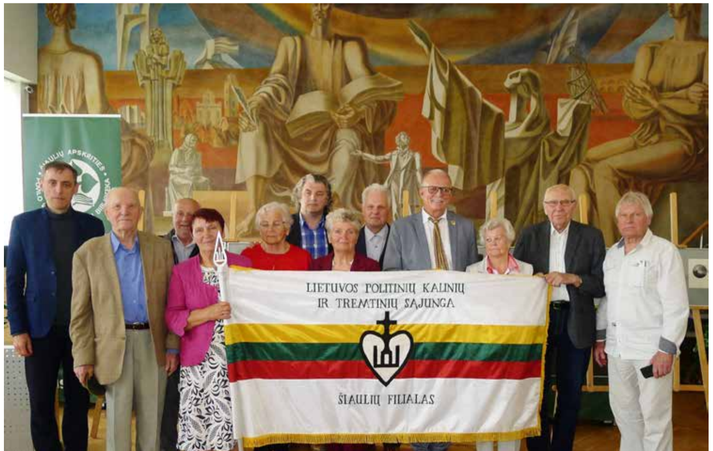
Lietuvos politinių kalinių ir tremtinių sąjungos Šiaulių skyriaus nariai, apsilonkę parodoje