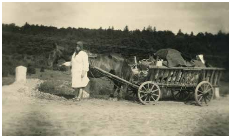
Prie sienos riboženklio, keliaujant į Vakarų. 1944 m. liepa