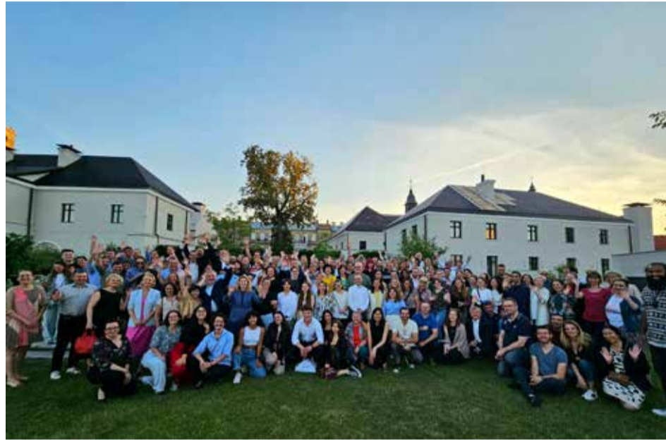
Tarptautinės konferencijos dalyviai Vilniuje.