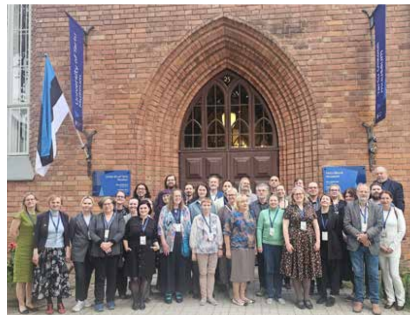
Konferencijos dalyviai.