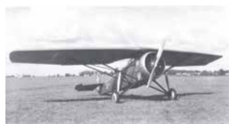
ANBO - aerodrome

1919 metais, vykstant kovoms už nepriklausomybę, susikūrusi aviacija ketvirtame XX amžiaus dešimtmetyje tapo gerai apginkluota ir organizuota karine jėga. Nuo 1930 m. Kaune, Karo aviacijos dirbtuvėse pradėta serijinė savos konstrukcijos lėktuvų, skirtų