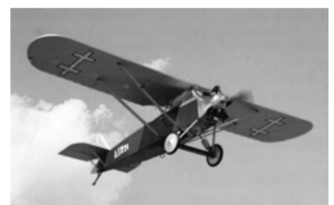
ANBO - ore

lakūnų mokymui ir treniruotėms bei žvalgybai, gamyba. Tuo Lietuva užėmė išskirtinę vietą tarp mažųjų Europos valstybių.