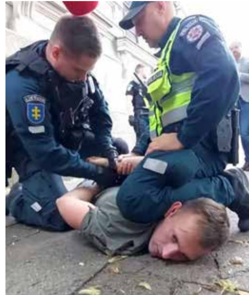
Policija susidorojo su protestuotojais. Darbininkai plėšia K. Škirpos atminimo lentą.