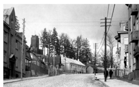
Vytauto Didžiojo paviljonas

1930 metais buvo numatyta Kaune, Vytauto kalne surengti Vytauto Didžiojo metų Žemės ūkio ir pramonės parodą, kuri vyktų