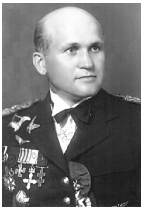
Antanas Gustaitis - karo lakūnas, lėktuvų konstruktorius, brigados generolas.

Kauno technologijos universiteto (KTU) Mechanikos inžinerijos ir dizaino fakultetas, tęsdamas gilią aviacijos tradicijas, 2024 m. gegužės 14 d. surengė konferenciją „Universiteto įnašas į Lietuvos aviacijos mokslą ir praktiką“. Renginys buvo skirtas ANBO (santrumpa reiškia „Antanas nori būti ore“) skrydžio 90-mečiui paminėti, prisiminti ir pagerbti itin reikšmingus Lietuvos aviacijos istorijos įvykius. Lietuviškų lėktuvų skrydis