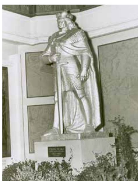
Vytautas Didysis Lietuvos paviljono Garbės salėje Pasaulinėje parodoje Niujorke (1939 m.). Skulptūra – augalų apsuptyje