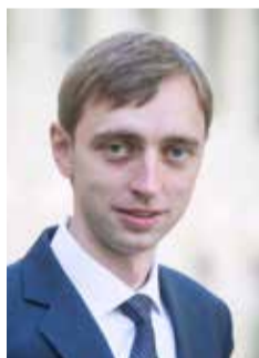
Dr. Linas Jurkšas

Centriniai bankai retai ir lėtai keičia palūkanų normas. Neseniai Europos centrinis bankas (ECB) sumažino palūkanų normą, praėjus 9 mėnesiams po paskutinio palūkanų normų pakėlimo, o pastarąjį kartą ECB pagrindinę palūkanų normą šiek tiek sumažino beveik prieš 5 metus. Vis dėlto šįkart palūkanų normos buvo sumažintos 0,25 procentinio punkto – taip smarkiai ECB palūkanas paskutinį kartą mažino beveik prieš 12 metų euro zonos skolų krizės įkarštyje.