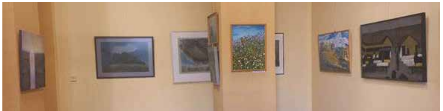
Paroda Lietuvos medicinos bibliotekoje