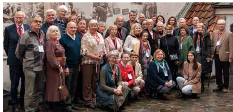
Konferencijos dalyviai.

Konferencija truko dvi dienas. Balandžio 4 d. mokslo filosofai rinkosi Vilniuje, Lietuvos kultūros tyrimų institute, o kitą dieną mokslo istorikai posėdžiavo Kaune, Lietuvos sveikatos mokslų universiteto Lietuvos medicinos ir farmacijos muziejuje.