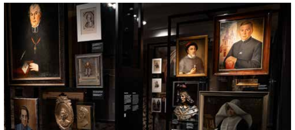
Pilininko namo ekspozicija.

Naujojo muziejaus lankytojai bus kviečiami išsakyti savo nuomonę, kuri iš teminių salių geriausiai atspindi Lietuvos tapatybę ir indėlį į šalies raidą. „Valstybės kūrimo procesas nėra vienkartinis ar statiškas. Ekspozicijoje „Suprasti Lietuvą“ lankytojai galės ne tik apžiūrėti eksponatus, bet ir patys kurti. Muziejuje įdiegti nauji technologiniai sprendimai leis visiems prisidėti prie Lietuvos audinio rašto kūrimo ar pasaulio gaublyje pažymėti šalis, kuriose emigravę lietuviai taip pat prisideda prie Lietuvos tapatybės kūrimo. Lankytojai sukurtą Lietuvos audinio raštą galės persikelti į savo el. įrenginį kaip užsklandą,