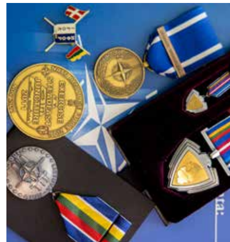
Paroda, skirta Lietuvos įstojimo į NATO 20-mečiui