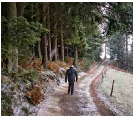
Miško kelias. Asoc. nuotr.

Naujasis sprendimas atitiks ne vienos tikslinės grupės poreikius, pradedant valstybinėmis institucijomis, kurios kasdien sprendžia su miškais ir jų keliais susijusius strateginius bei praktinius klausimus: Valstybine miškų urėdija, Valstybine miškų tarnyba, Aplinkos ir Susisiekimo ministerijos. Miškų savininkams sistema padės