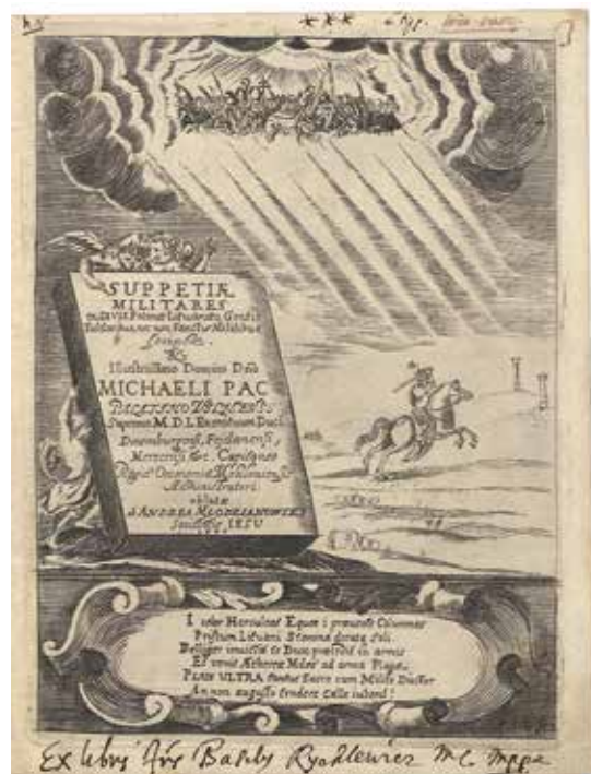
Emblemų rinkinio, dedikuoto M. K. Pacui, antraštinis lapas. Vilnius, 1671. T. Šnopsos vario raiziny. LMAVB RSS L-17/86