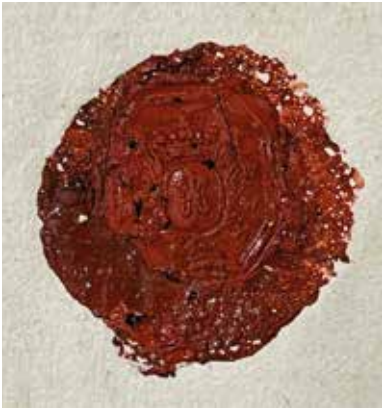
Signetinis raudono vaško M. K. Paco antspaudas laiške Laterano reguliniams kanauninkams prie Vilniaus Šv. Petro ir Povilo bažnyčios. Vilnius, 1675-07-12, LMAVB RS F20-912, lap. 3r.