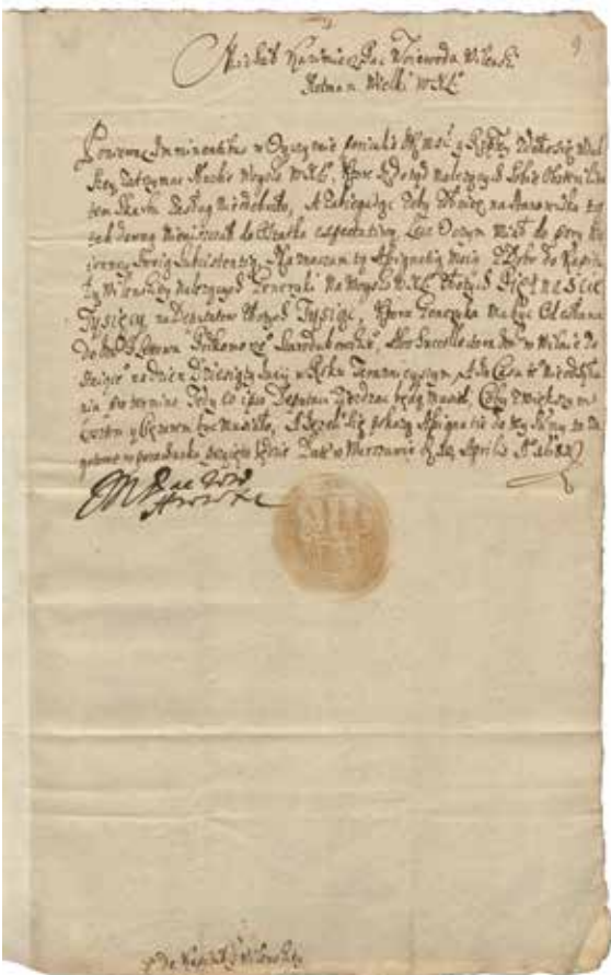
M. K. Paco antspaudas ir parašas 1681 m. dokumente. LMAVB RS F43-3972, lap. 9r.