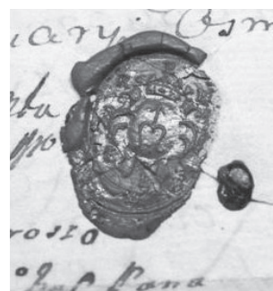
Antano Previš-Kvintos antspaudas. VUB RS, F67-3285