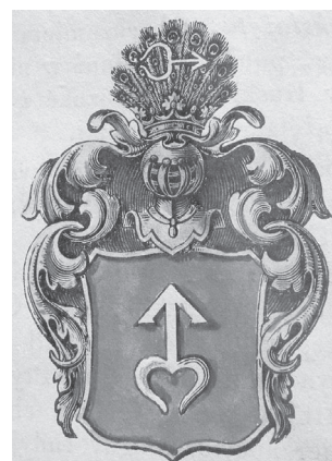
Odrovonžo herbas. Iš knygos: Niesiecki, Kasper. Herbarz Polski . Lipsk, 1841, t. 7, p. 24