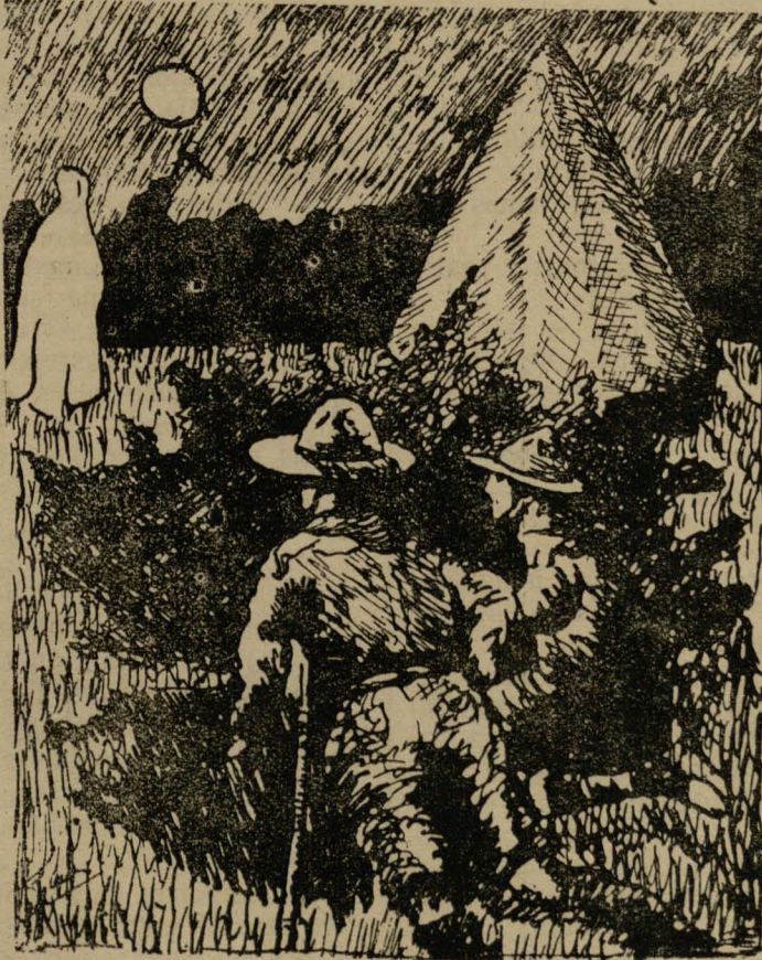
Šmėkla stovėjo šimtas metrų nuo palapinės.

Berniukai pasislėpė už jo ir sekė „šmėklą“, Toji menamoji šmėkla stovėjo šimtas metrų nuo palapinės. Netrukus jį pradėjo artintis prie jos.