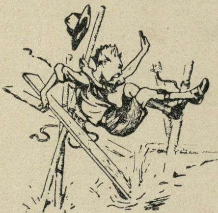
TOMAS STATĖS TILTĄ.

Tomas—skautas! Tad kodėl jis, tilto gi nepastatytų? O suriši, tai ką gi! Argi šunmazgiai jau nelaikytų?