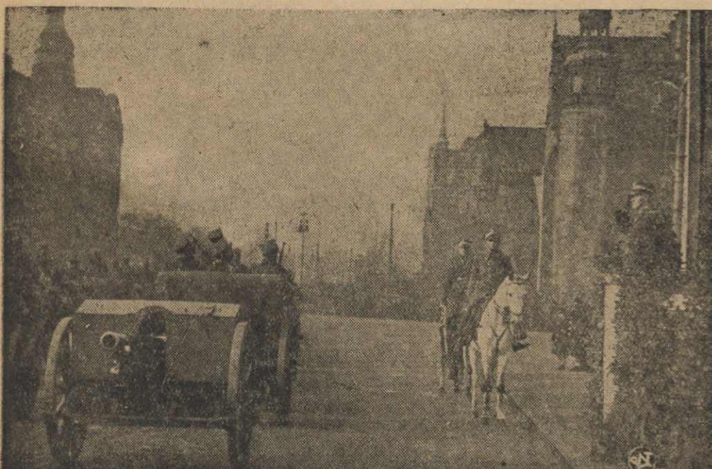
Uroczystości 17-iej rocznicy powstania Wielkopolskiego które odbyły się w piątek 27-go bm. w Poznaniu wypadły imponująco. Na placu Wolności odbyła się defilada przed Wodzem Nacelnym w obecności 25 tysięcy b. powstańców wielkopolskich.