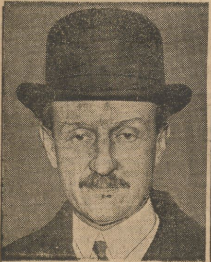
KAMIL CHAUTEPS premier ustępującego rządu.

sprecyzowane. Jednak wiele osobistości politycznych, z którymi przeprowadzono rozmowy, wypowiedziało się jasno, iż należy utworzyć rząd ocalenia publicznego, któryby był jedynym zdolnym dać opinii publicznej niezbędne zapewnienie przeprowadzenia pokoju między partiami, przywrócenia ładu na ulicy i niezbędnych sankcji, jakie pociągnąć powinny znajdujące się obecnie w toku sprawy sądowe.