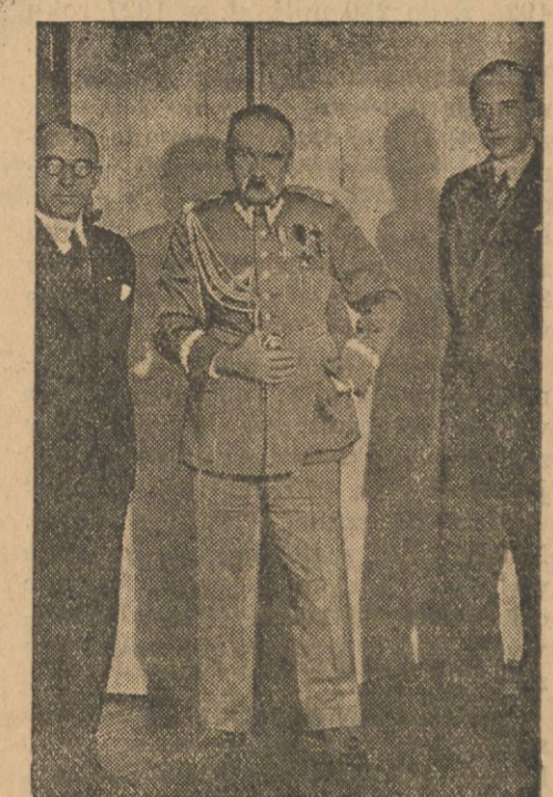
Pan Marszałek Piłsudski przyjął w Belwederze p. Helmara Rostinga prowizorycznego wysokiego komisarza Ligi Narodów w Wielkiem Miście Gdańsku. Na ilustracji naszej stoją od lewej wysoki komisarz Rosting, Pan Marszałek Piłsudski oraz wice-minister Spraw Zagranicznych Beck.

Wysoki komisarz Rosting u Pana Marszałka Piłsudskiego.