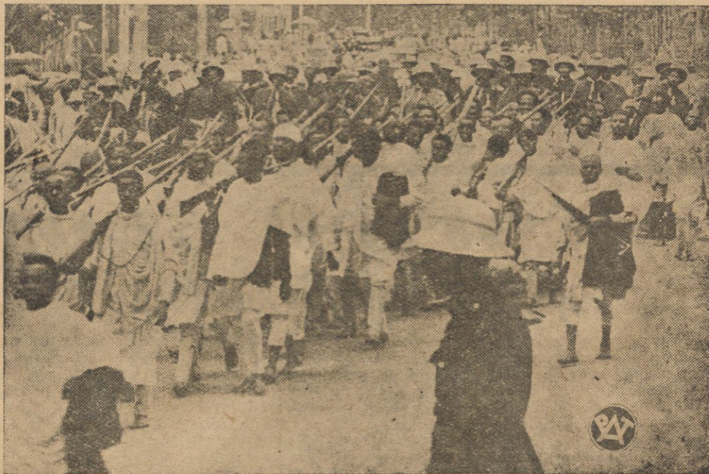
Wymarsz oddziału wojsk abisyńskich z Addis-Abeby.