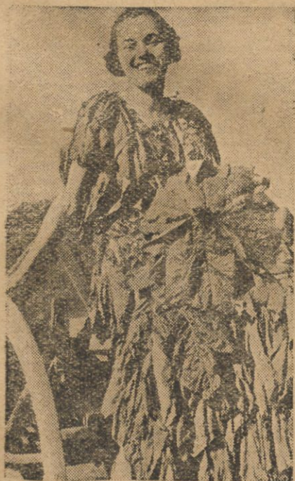
Tym razem — królowa tytoniu w oryginalnym stroju z liści tytoniowych, gdzie? — Oczywiście w Ameryce.