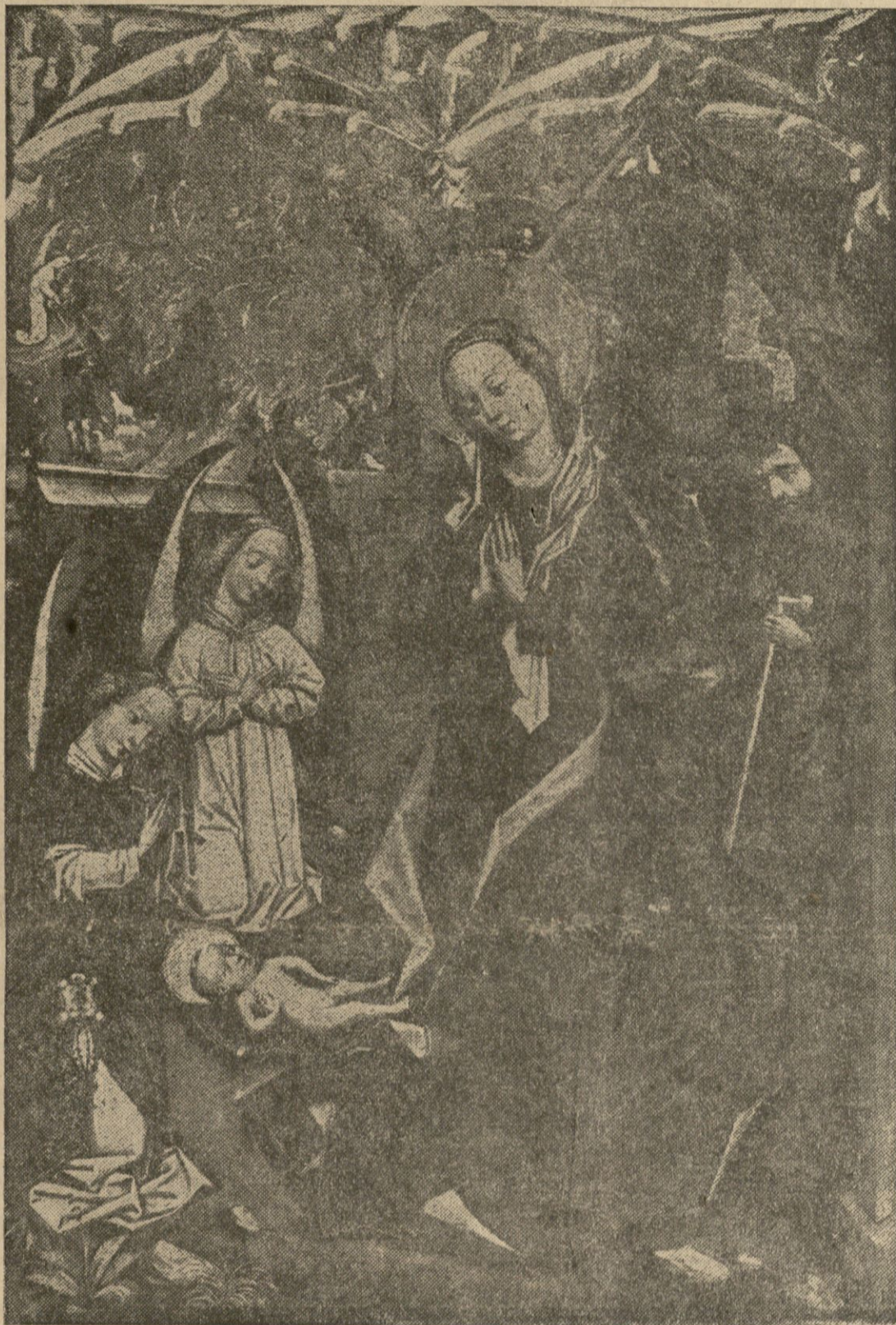
Kwatera polipytyku w kościele farnym w Olkuszu. Malarstwo krakowskie, ok. 1485 r.