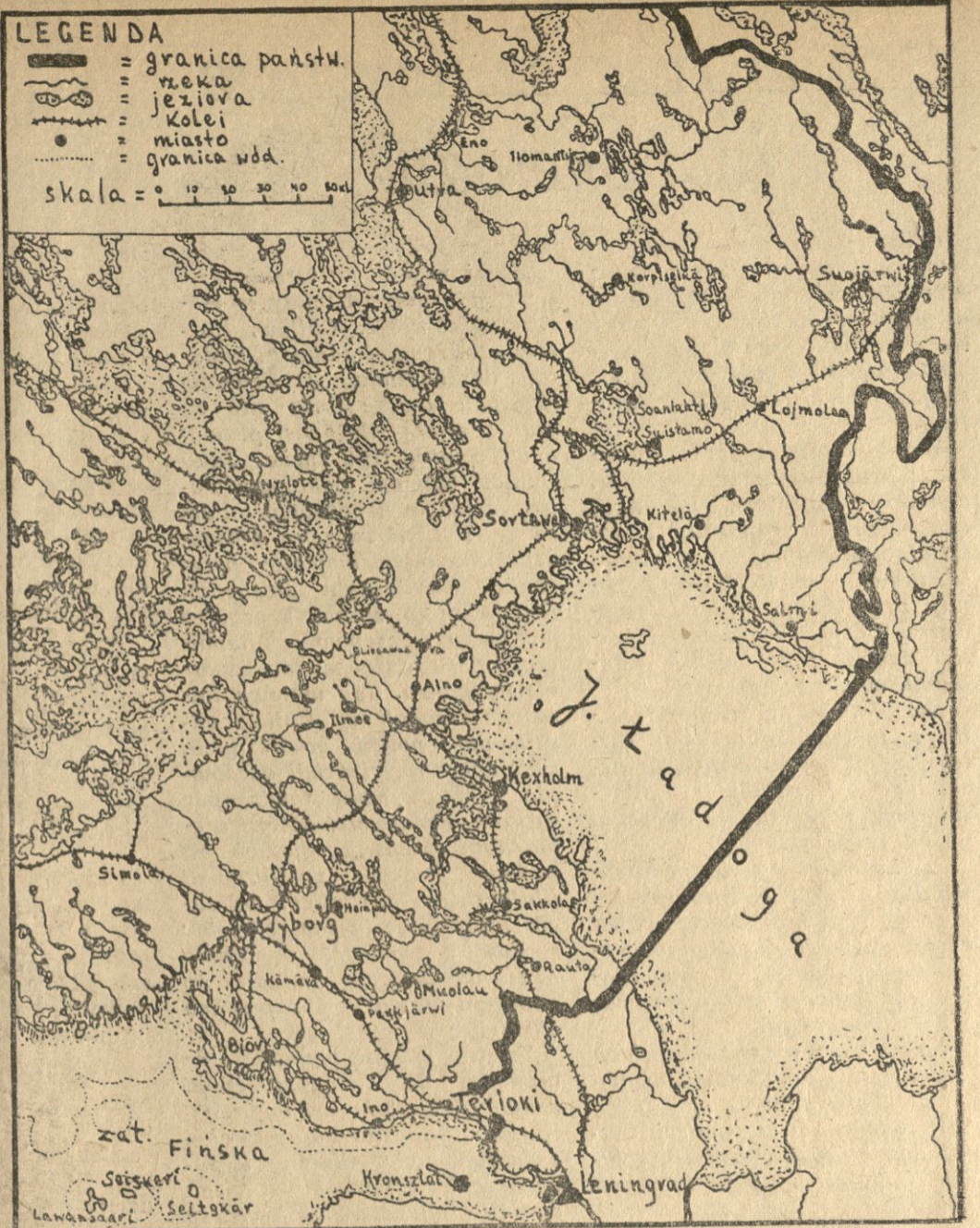
Mapa środkowej części Finlandii — teren „frontu uchtyńskiego”. Objasnienie znaków na mapie. Mapa południowo-wschodniej części Finlandii. Na zachód od Ładogi teren „frontu leningradzkiego”.

Wiadomości o pierwszych starciach zbrojnych na pograniczu fińsko-sowieckim przyniosły gazety z 27-go listopada.