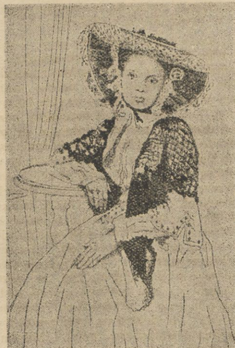
MARJA Z BILLEWICZÓW PIŁSUDSKA, matka ś. p. Marszałka.

może także, że niedowiarki, tacy którzy poddają w wątpliwość nawet głębie własnemu sercu przejdą nieporuszeni obok głębokiego i istotnie prawdziwego sensu niektórych cudów. Co do mnie, nie mogę serca mego zamknąć przed tą jasną i zniewalającą prawdą, wydartą z szarej mgły nieprawdopodobieństwa i w cud