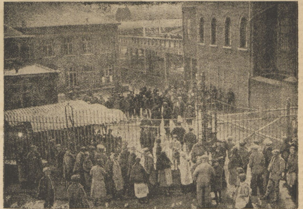
W belgijskich kopalniach węgla wytworzyła się wskutek strajku górników bardzo poważna sytuacja, która dorasta do wielkości rewolucji przez solidarność mieszczaństwa ze strajkującymi górnikami. Brygady żandarmerji musiały interwenjować, używając gwałtu, strajkujący widzieli strajkujących górników, obsadzających kopalnię Sainte Pauline obok Charleri. Przed kratą stoją żony strajkujących. Dopiero gdy bomby izawijące podziały kopalnie zostały oczyszczone.