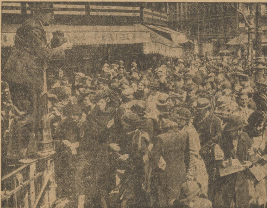
W Paryżu zastrajkowały panny sklepowe, przewane „midinetkami“. Na zdjęciu — strajkujące „midinetki“ w pochodzie do Giełdy Pracy.