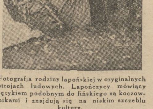
Fotografia rodziny lapońskiej w oryginalnych strojach ludowych. Lapończycy mówiący językiem podobnym do fińskiego są koczownicami i znajdują się na niskim szczeblu kultury.

W krainie Lapończyków. Fotografia rodziny lapońskiej w oryginalnych strojach ludowych. Lapończycy mówiący językiem podobnym do fińskiego są koczownicami i znajdują się na niskim szczeblu kultury.