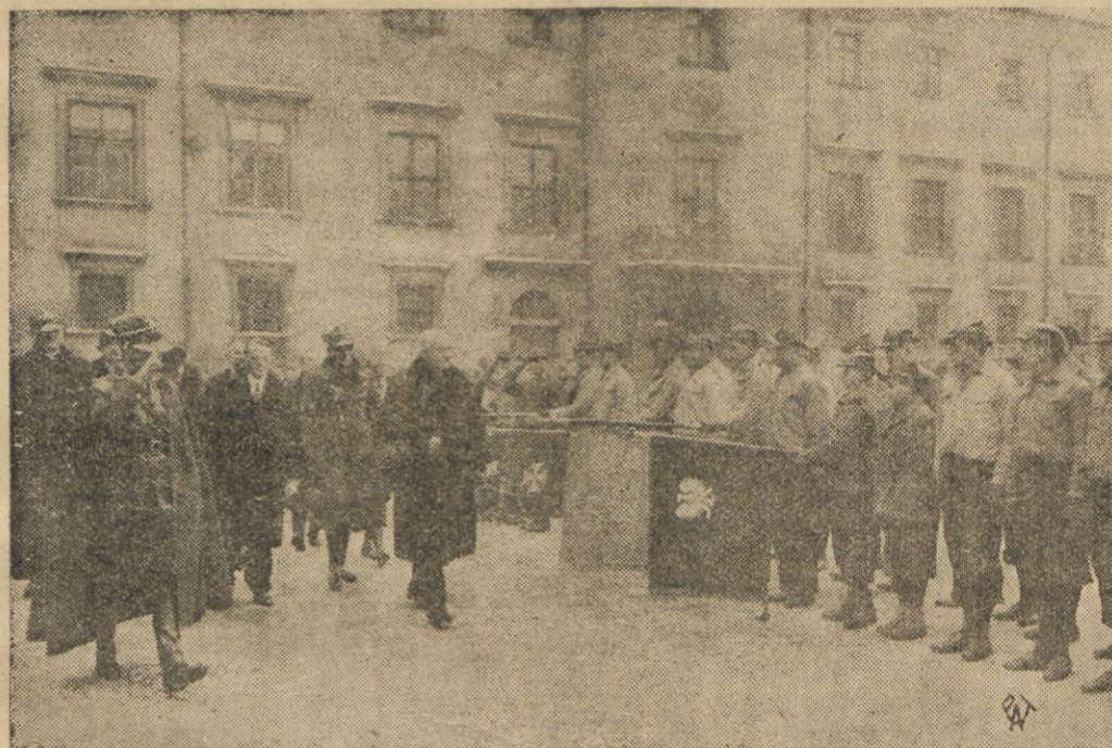
W przeddzień imienin Pana Prezydenta Rzplitej prof. Ignacego Mościckiego złożyli mu hołd na dziedzińcu zamkowym delegacje szkół, oraz organizacje młodzieżowe. Na zdjęciu — harcerze składają hołd Głowie Państwa