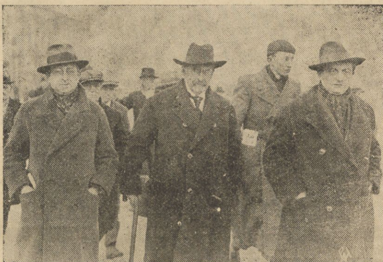
W tych dniach król belgijski przyjął delegację bezrobotnych z przywódcą socjalistów Vanderwelde na czele. Na zdjęciu — delegacja z Vanderwelde i posłem Pierardem na czele w drodze do pałacu królewskiego