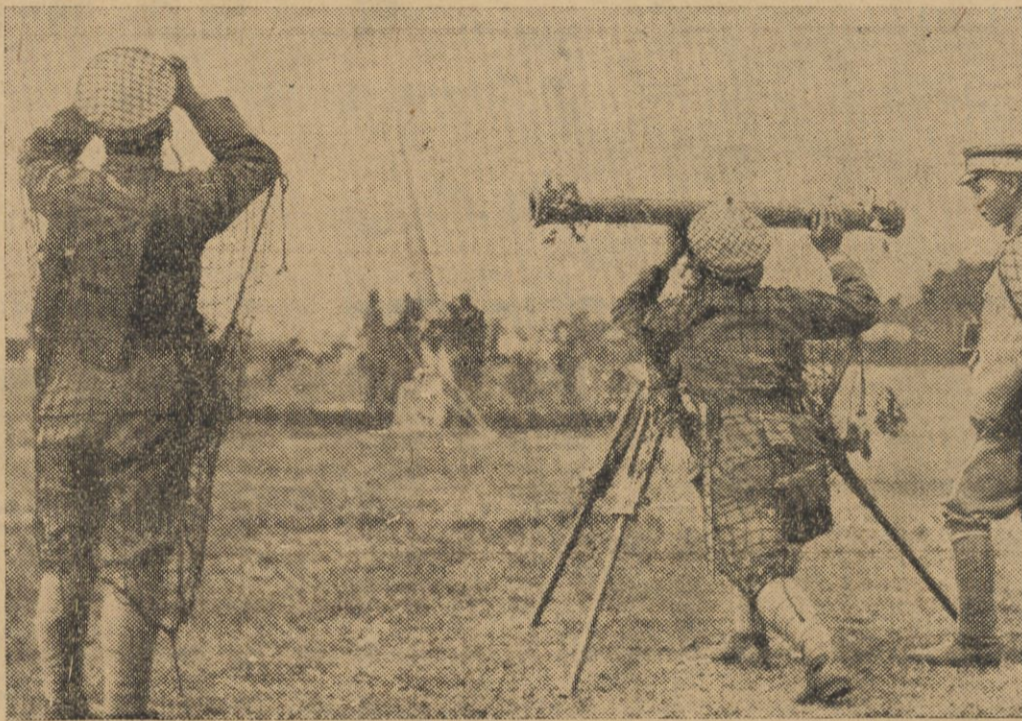
Na wyspie Kyusza w Japonji odbyły się niedawno wielkie manewry wojenne. Na ilustracji — fragment manewrów: oddziały przeciwlotnicze podczas ataku.