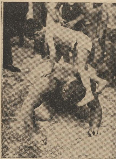
Mistrz ciężkiej wagi pokonany...

Simon rozprostował obolałe członki. — Wszedłem po murze. Świetna gimnastyka! Czy mógłbym się czego napić?..