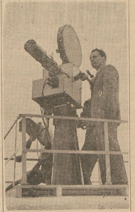
Na wielkiej dorocznej wystawie radjowej w Berlinie jest czynny powyższy aparat do zdjęć telewizyjnych.